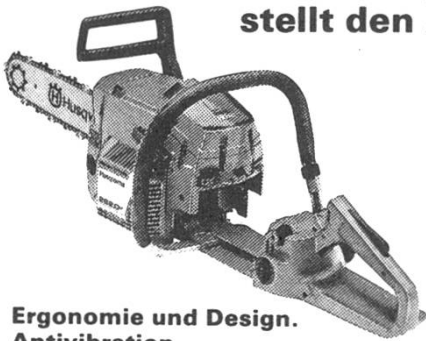
Ergonomie und Design. Antivibration.

Das Husqvarna-Konstruktionskonzept stellt den Anwender in den Mittelpunkt.