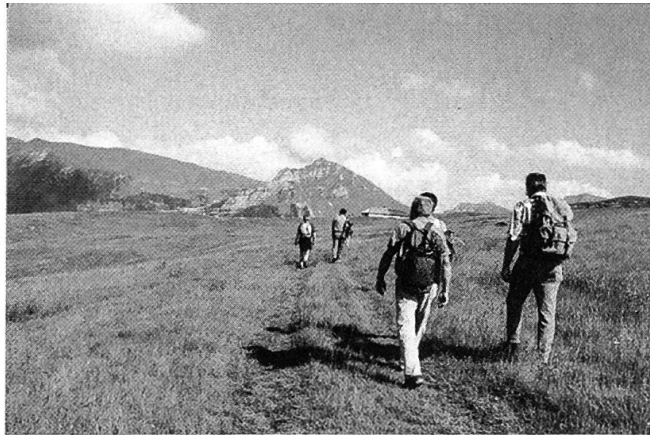
Figure 8. La région du Niremont – les Alpettes offre de belles promenades.