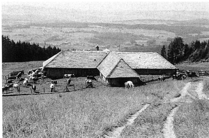
Figure 2. Chalet de la Moille Vieille avec vue sur la plaine et le Jura.

Mais il serait faux de prétendre que la commune de Semsales n'est faite que de beautés naturelles et qu'elle ne connaît pas de problèmes. Dans le passé, Semsales a souvent été frappé de malheurs. L'histoire raconte que vers la fin du 13 ème siècle, un énorme éboulement avait détruit le village. Un second éboulement, tout aussi catastrophique, a englouti à nouveau les habitants au 17 ème siècle. On pense que cet éboulement se situait au lieu dit «Au Tey», à 1 km au nord du village actuel. Le 16 mars 1830, un incendie détruisit 42 maisons, soit les 2/3 du village.