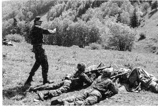
Figure 11....la Place de tir d'infanterie.

Toutefois, on constate qu'à Semsales, les anciens syndicats, particulièrement ceux d'endiguement des affluents de la Broye et de la Sarine ne fonctionnent plus ou ont des problèmes financiers. Il s'agira de reconstituer un ou plusieurs syndicats à buts multiples, à l'intérieur desquels la commune de Semsales sera fortement représentée en tant que propriétaire et autorité.