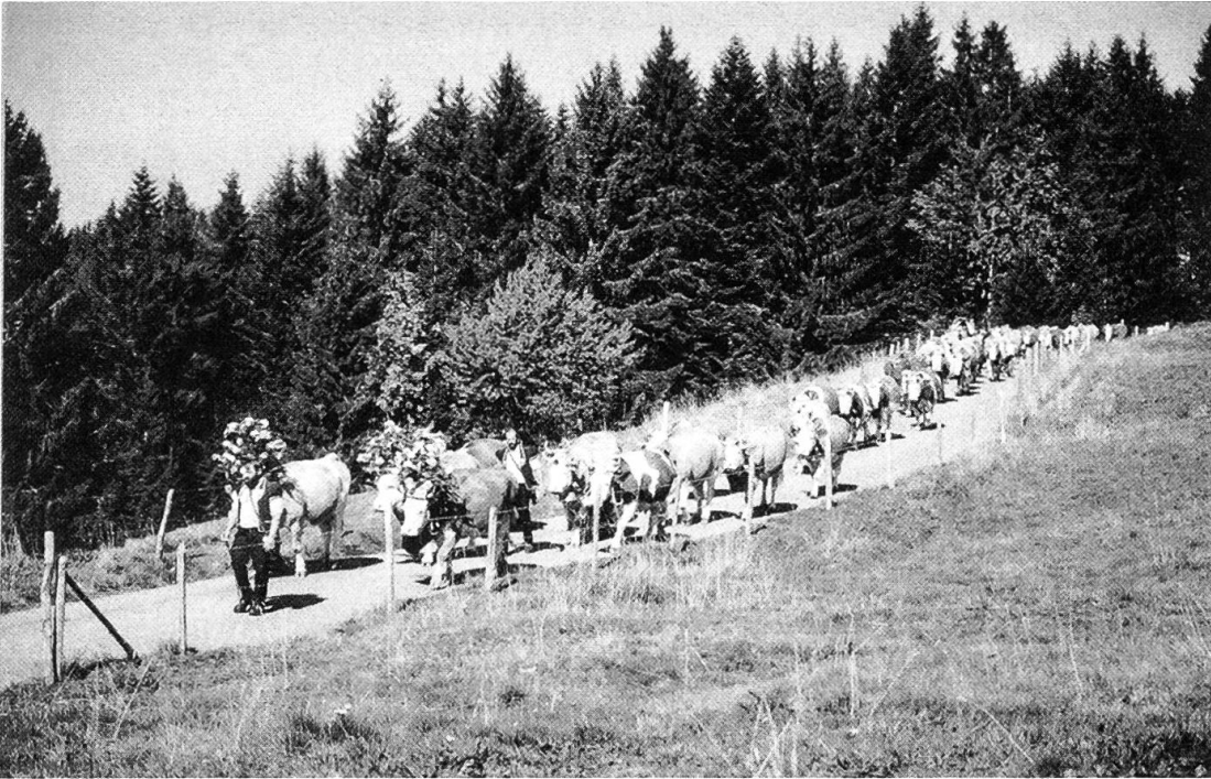
Figure 3. Les premiers jours d'octobre c'est la désalpe, qui donne lieu à une grande fête de village.