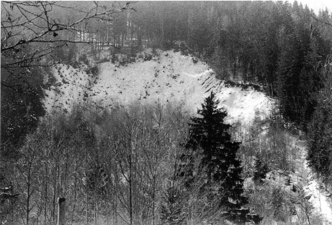
Figure 4. L'affouillement du pied des berges de la Mortivue et l'érosion, images typiques à Semsales.