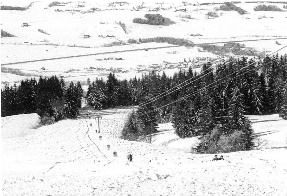
Figure 7. Le tourisme d'hiver dans les préAlpes souffre parfois d'un manque de neige.

Malgré les efforts consentis dans le passé, les anciens problèmes n'ont pas disparu et d'autres s'y sont ajoutés, suite à l'évolution des mentalités, aux nouvelles activités et aux exigences d'une population en constante augmentation. D'autre part, les anciens ouvrages nécessitent une restauration. Si, dans le passé, les 3 services de l'Etat précités étaient quasiment les seuls à s'intéresser aux problèmes montagnards de Semsales, la situation a aujourd'hui évolué. D'autres intervenants (aménagement du territoire, protection de la nature, tourisme d'été et d'hiver, armée, etc.) ont pris de l'importance et participent activement à la gestion du territoire ( Figures 7 et 8 ).