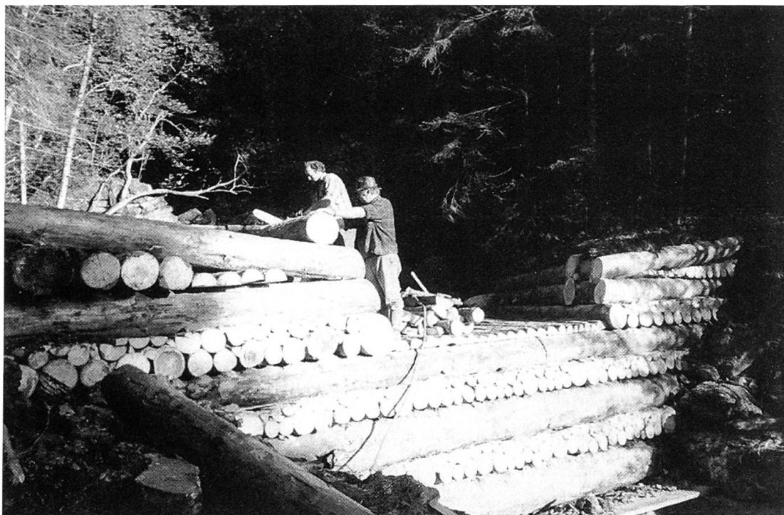
Figure 6. Aujourd'hui, la plupart des barrages se fait à nouveau en bois par l'équipe forestière communale.