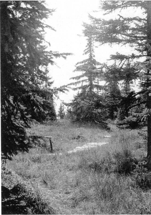
Figure 10. Le site protégé du Niremont est en voisinage direct avec...