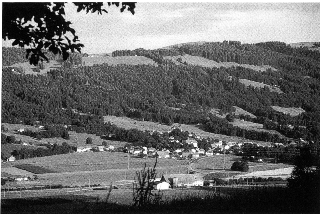
Figure 1. Vue du village de Semsales avec les forêts et les pâturages sis sur les pentes douces du Niremont.