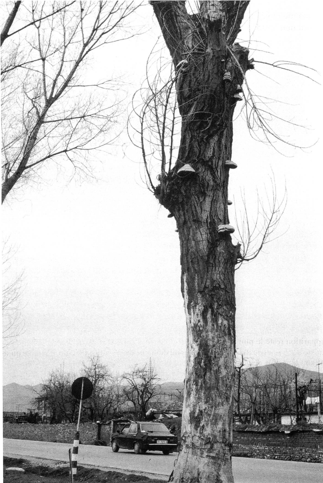
Abbildung 3. Populus cf. nigra in der Nähe von Tirana, Albanien, mit Fruchtkörpern von Fomes fomentarius und starken Stammverletzungen.