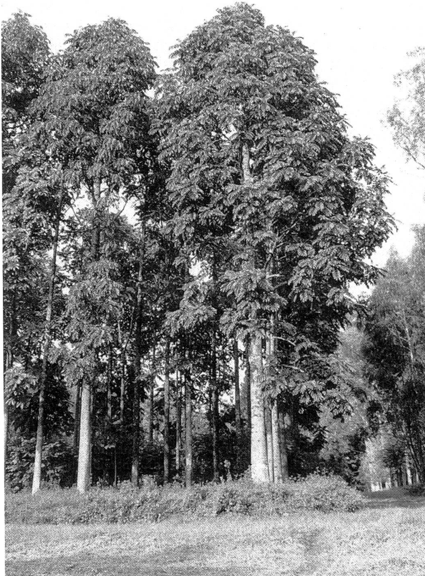
Figure 2. L'Acajou de montagne ( Entandrophragma excelsum ) est une des espèces performantes de la forêt naturelle rwandaise.

En plus des Eucalyptus, d'autres feuillus exotiques (57 espèces) ont été introduits à l'Arboretum. Parmi ces derniers relevons le Chêne liège ( Quercus suber ) originaire du bassin méditerranéen; le Jacaranda mimosifolia , originaire d'Amérique du Sud et très répandu comme arbre d'ornement au bord des avenues; le Filao ( Casuarina equisetifolia ) au bois très dur utilisé entre autres pour la fabrication d'outils de menuiserie (rabots). Plusieurs espèces ont été introduites pour leur usage en agroforesterie, tels que le Grevillea robusta d'Australie, le Leucaena leucocephala d'Amérique Centrale, le Cassia spectabilis de Malaisie, l' Acrocarpus fraxinifolius et le Cedrela serrata d'Inde. (Figure 1). Quelques espèces d'autres régions africaines, tels que le Fromager ou Kapokier ( Ceiba pentandra ), le Tulipier d'Afrique ou Flamboyant ( Spathodea campanulata ) et le Limba ( Terminalia superba ) sont également présents.