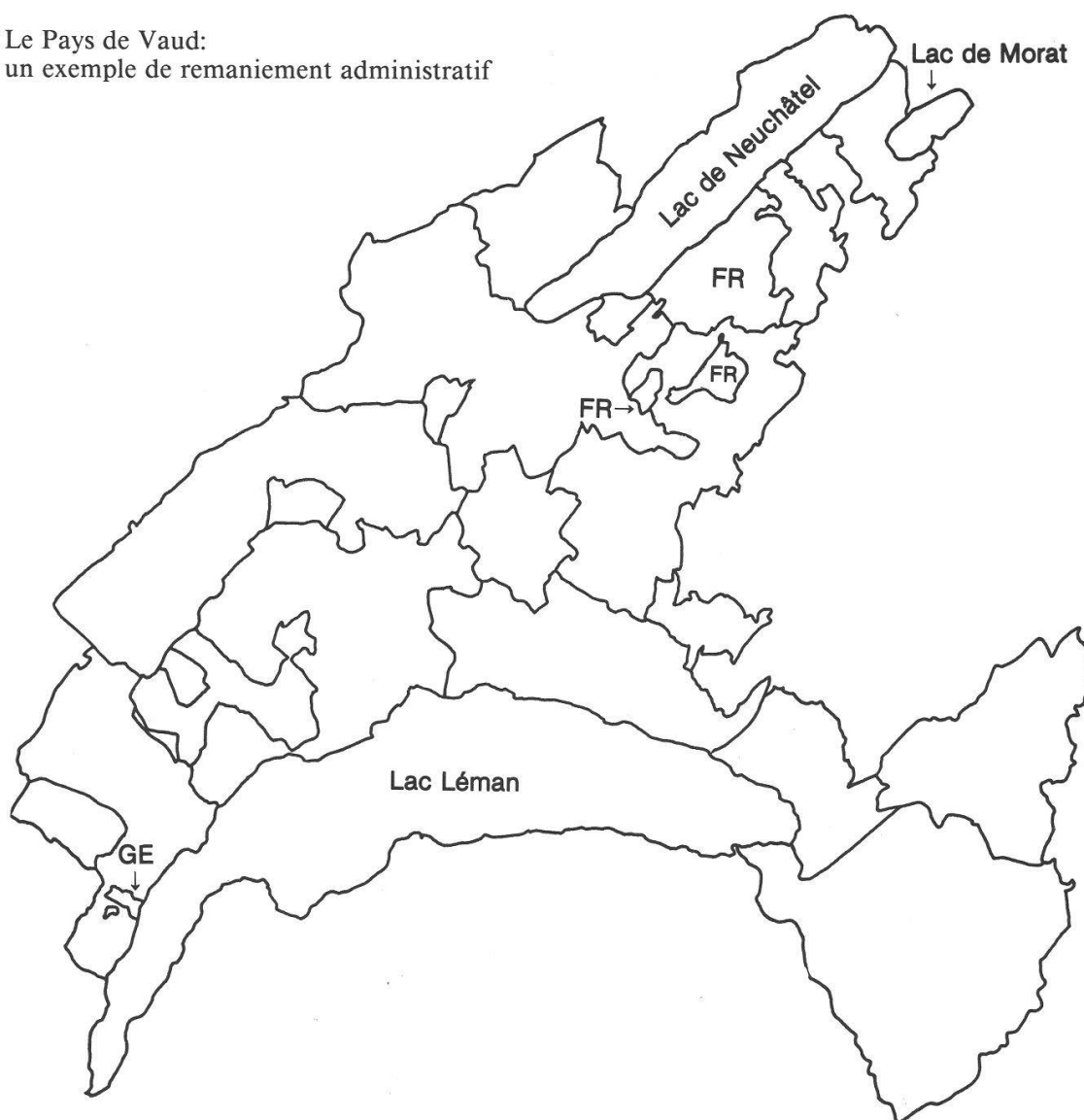
Carte 2a. Sous le Régime bernois, une bigarrure héritée de l'histoire.

Le Pays de Vaud: un exemple de remaniement administratif