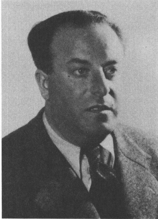
Der abgesprungene und ermordete Ignaz Reiss (1899–1937) hatte für den Abwehrdienst der Roten Armee Informationen über die Aufrüstung im Dritten Reich gesammelt.