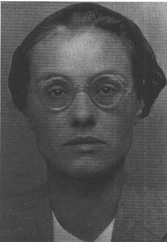
Vera Traill-Gutschkov (1906–1986) steht für jenen Teil der russischen Aristokratie, der an der grossrussischen Politik Stalins Gefallen fand.