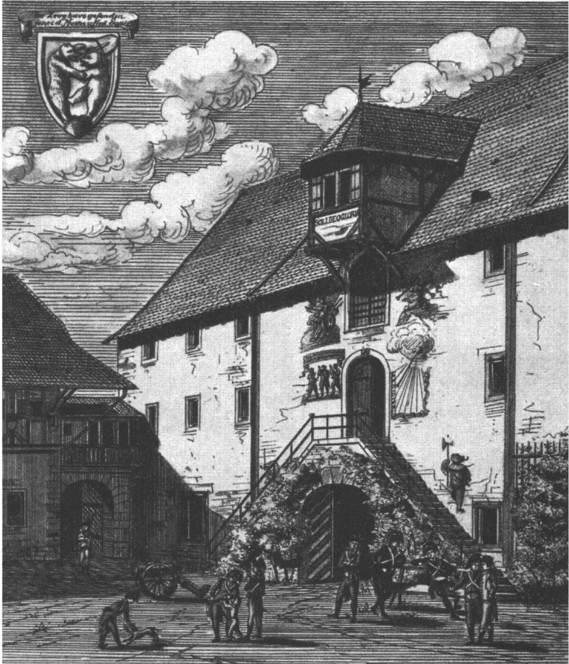
Abbildung 2. Bemalte Portalfront des Zeughauses Bern, um 1870. Federzeichnung von Ed. v. Roth; nach: Die Kunstdenkmäler des Kantons Bern .

beim Schwur zeigt 46 . Darunter war eine Inschrift angebracht, die den ausländischen Reisenden über die dargestellte Szene aufklärte: «Als