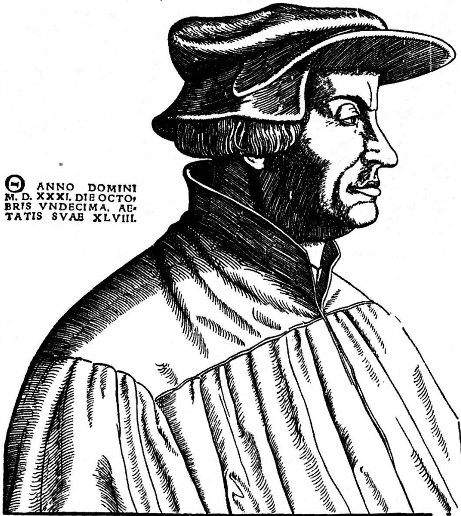
Figure 2. Portrait de Zwingli, Gravure sur bois, 41 × 26 cm, Zurich, Zentralbibliothek.

cond est un portrait anonyme de Leo Jud, aujourd'hui à la Zentralbibliothek de Zurich: Jud y est représenté là aussi de trois quart gauche, à mi-corps, avec un livre dans lequel sa main gauche marque une page, en allusion à son activité de pasteur 25 . La légende latine fonctionne également ici comme une sorte de récapitulation de la vie de Jud, ou plus exactement de son activité pastorale à Zurich dans la paroisse Saint-Pierre de 1523 à 1542. La troisième image, provenant elle aussi de la bibliothèque de Zurich 26 , montre Zwingli de profil et paraît dater des années 1540: à gauche, une légende confère bien à cette image le carac-