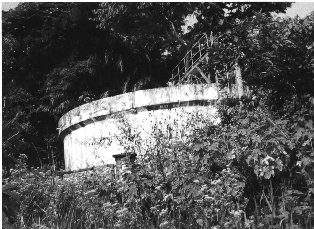
Figure 4: Château d'eau de Ndikiniméki/Crédit mixte suisse I, photographie de l'auteur du 11 décembre 2019.

Ndikiniméki fut effective en 1986 et l'UNEFICO demanda sa réception définitive le 17 décembre 1987. 53 Ces systèmes d'adduction d'eau potable issus de la coopération suisse-camerounaise avaient des capacités impressionnantes. Le centre de Campo, dont l'usine était dotée d'une capacité nominale de 220 m 3 /jour, avait une production de 28 m 3 /jour et un taux de saturation de 12.73 % et devait desservir 33 abonnés. 54 Concernant Zoétéélé, l'usine avait une capacité nominale de 480 m 3 /jour, une production de 38 m 3 /jour, un taux de saturation de 7.92 %, et devait ravitailler 104 abonnés. 55 Néanmoins, il convient de préciser que, malgré leur importance, l'exploitation de ces adductions d'eau fut gênée par l'absence de compteurs d'eau brute et d'eaux traitées. 56 Une situation morose qui fut vite réglée par les partenaires bilatéraux en vue d'assurer de façon effective l'épanouissement des populations locales. Toutefois, l'alimentation en eau pota-