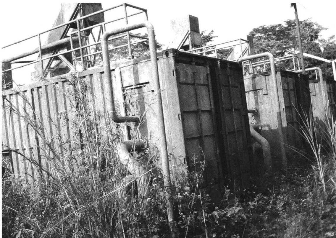
Figure 1: Vue externe de la station de traitement des eaux de NdiKiniméki, financée par le crédit mixte bilatéral I, photographie de l'auteur, 11 décembre 2019.

ménages. Ces situations moroses n'étaient pas sans impact négatif sur le mode de vie des populations riveraines souvent contraintes de se ravitailler directement dans des cours d'eau avec tous les risques sanitaires encourus. 48 Tout seul, il était difficile pour le jeune État du Cameroun d'apporter des solutions à ces problèmes, raison pour laquelle la question urgente de composer avec des partenaires étrangers se posait avec acuité.