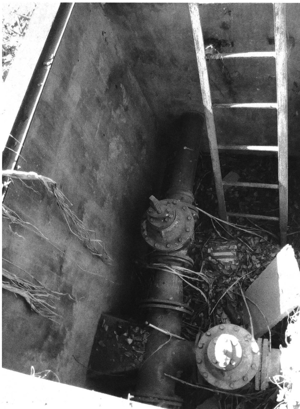
Figure 7: Accessoires de canalisation du château d'eau de Makénéné, photographie de l'auteur, 11 décembre 2019.

Makénéné puissent maintenant être utilisées pour le bénéfice des populations locales concernées. 70