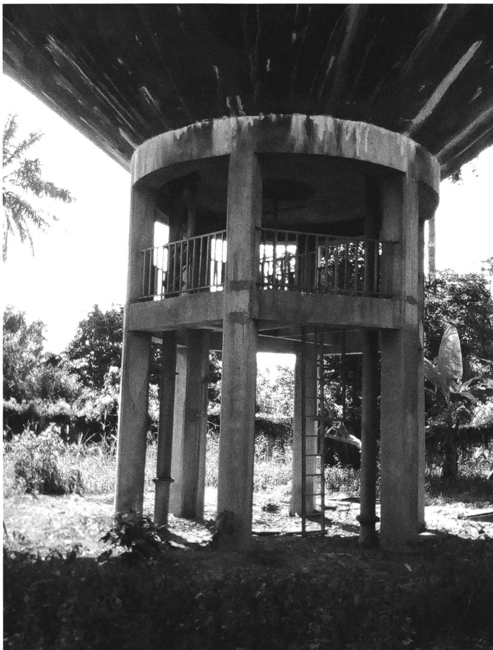
Figure 6: Château d'eau de Makéné, vue de la partie inférieure, photographie de l'auteur, 11 décembre 2019.

Nous nous référons à la réception provisoire de l'ouvrage sus-mentionné qui a eu lieu le 13 mars 1991 et aimerions vous en remercier des efforts considérables que vous avez déployés au cours de ces derniers mois pour aboutir à la réception définitive de la station de Ndikiniméki, puis dans un deuxième temps, à la réception provisoire de Makéné. Nous sommes particulièrement satisfaits de l'achèvement des travaux de Makéné qui constituait, déjà depuis un certain temps, l'objectif prioritaire de notre coopération crédit mixte avec le Cameroun. D'un point de vue plus général de développement, nous sommes très heureux que les installations de