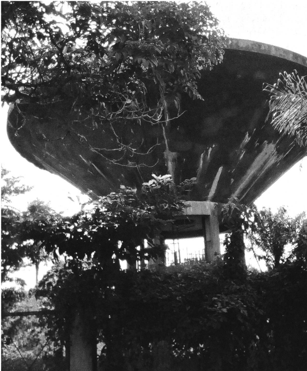
Figure 5: Château d'eau de Makénéne, vue de la partie supérieure, photographie de l'auteur, 11 décembre 2019.

clôtures et des remblayages compactés, de parachever certains ouvrages de protection de la conduite d'eau et de ses équipements, d'assurer les finitions des plates formes et pistes d'accès du château d'eau. Toutes ces tâches achevées, la réception provisoire de l'ouvrage fut fixée pour le 13 mars 1991 69 . Cette phase du projet fut positivement appréciée par l'OFAEE qui ne cacha pas sa satisfaction à travers son administrateur P. Obrist dans une lettre adressée à l'entreprise UNEFICO et transmise à l'ambassade de Suisse à Yaoundé le 12 avril 1991 :