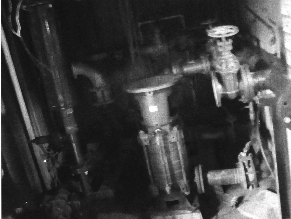
Figure 2: Vue interne de la station de traitement des eaux de Ndikiniméki, photographie de l'auteur, 11 décembre 2019. Au milieu des machines on aperçoit le moteur de pompage des eaux qui est endommagé et nécessite d'être remplacé afin d'assurer le ravitaillement en eau potable des populations de Ndikiniméki et de Makénéké. Cette pièce est indispensable dans le fonctionnement du système d'adduction d'eau.

difficultés à trouver un emploi dans leur pays d'origine. Il ne s'agissait donc pas d'une coopération désintéressée.