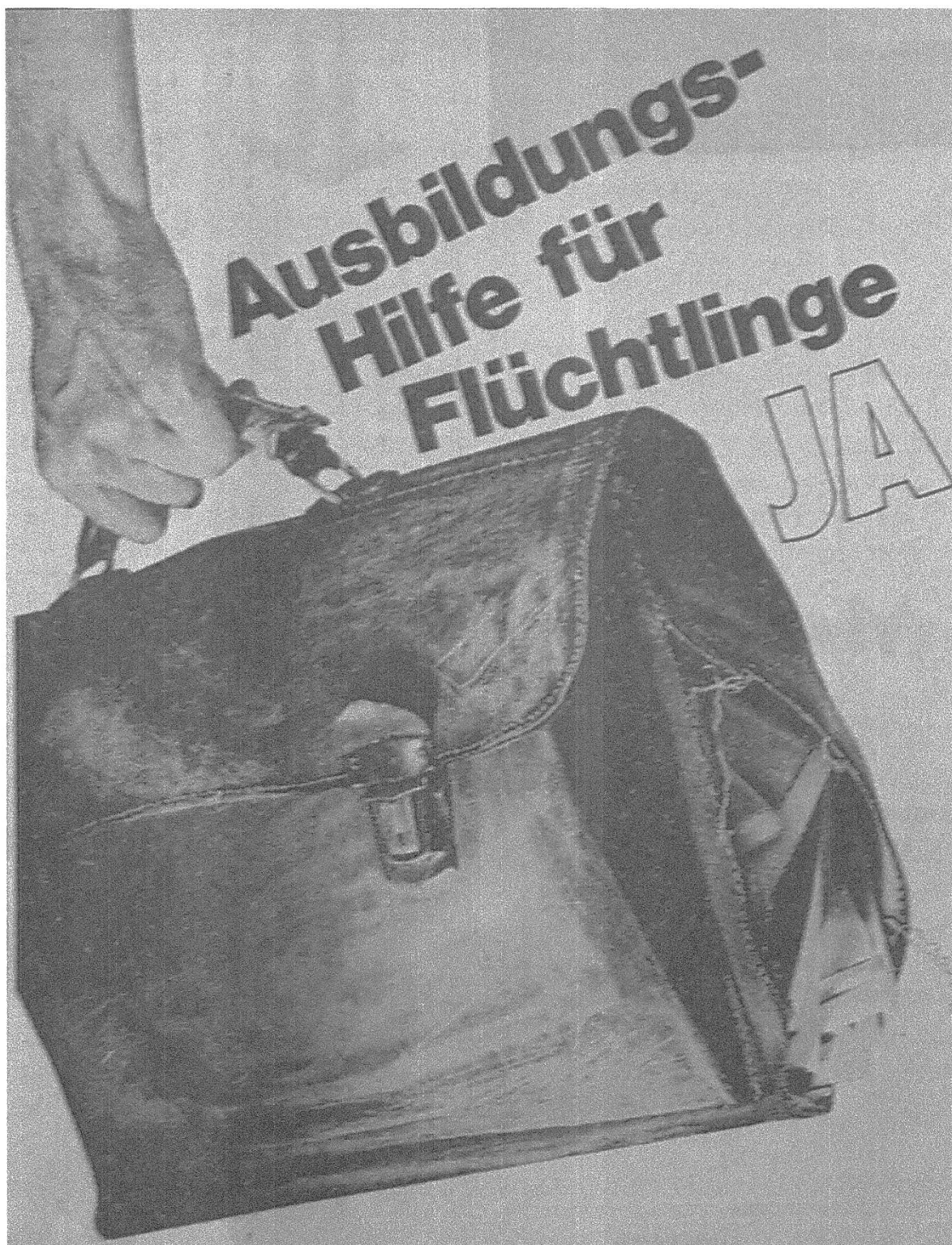
Dessin 2. Affiche de campagne de l'Aktionskomitee Ausbildungshilfe für Flüchtlinge, 1976.

bourses sont données à des «fähige ausländische Studenten». 68 De plus, les bourses évitent aux réfugié·e·s de se retrouver sur le marché de l'emploi, menaçant ainsi les travailleurs suisses dans une conjoncture économique qui