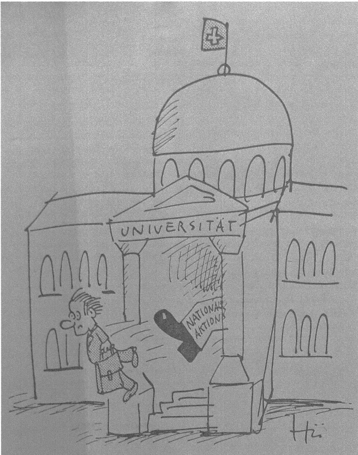
Dessin 1. Zürcher Student, mai 1976, p. 4.

seurs des hautes écoles. Parmi les étudiant-e-s, le soutien aux réfugié-e-s repose sur une base très large. À côté des groupes progressistes, des associations créées en réaction à la gauchisation des années 1970, à l'instar de SOSeth, militent aussi