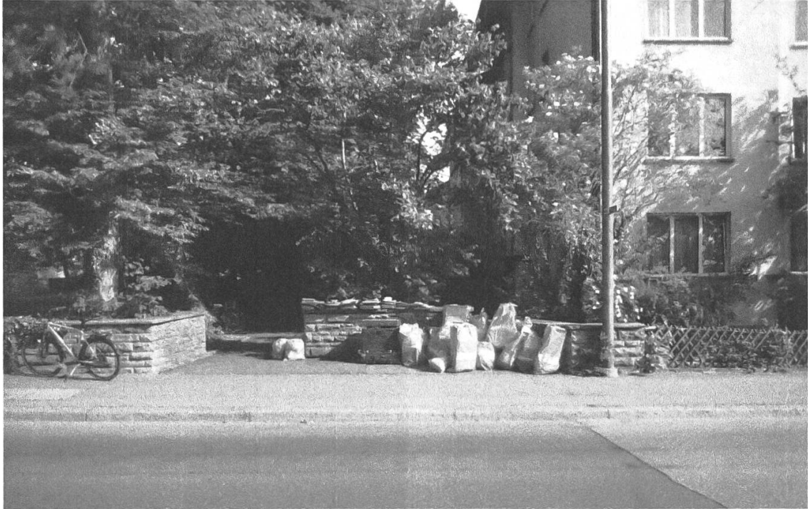
Abb. 1: Fundstelle des Jegerlehner-Nachlasses: Schosshaldenquartier in Bern, 24.5.20 (Foto Beat Hodler).