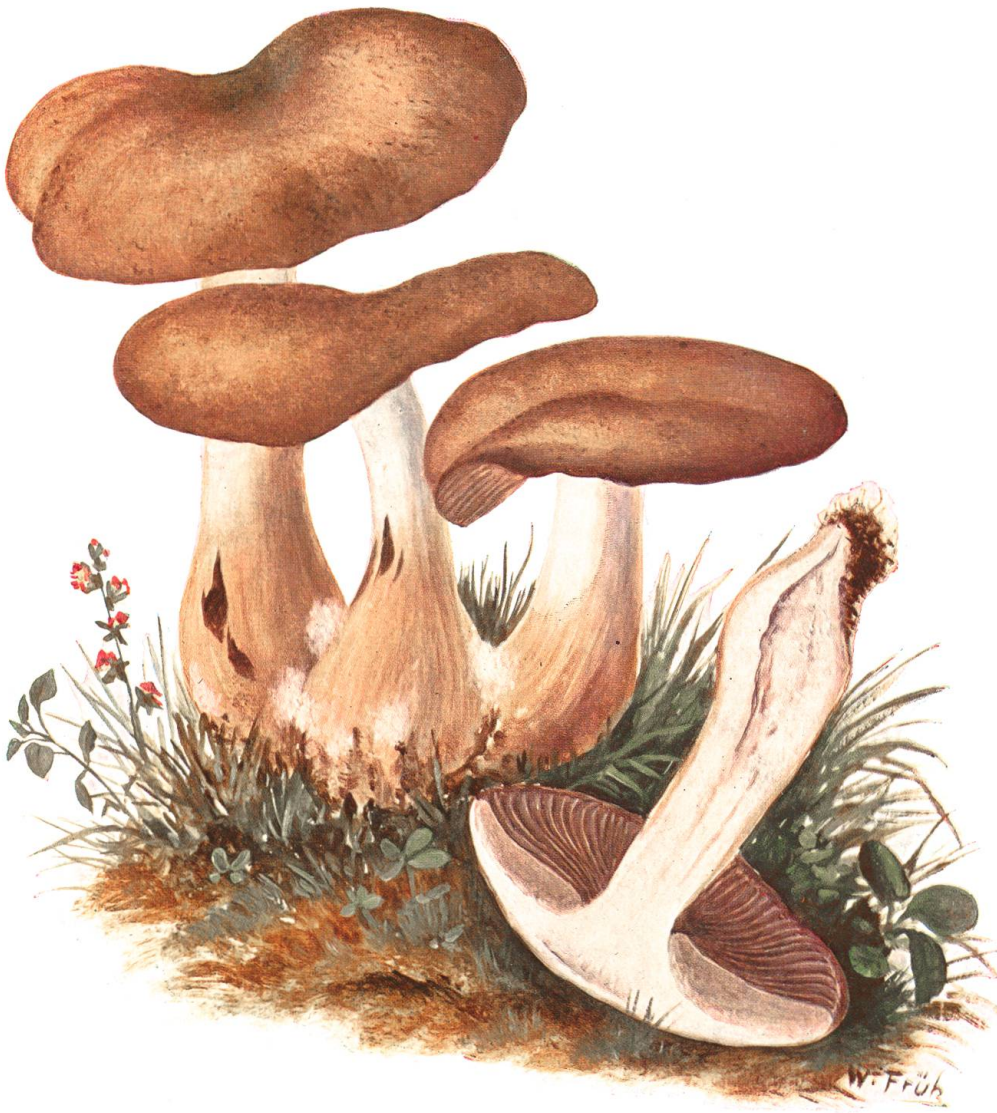
Tricholoma trigonosporum (Bres.) Ricken Dreieckigsporiger Rasling