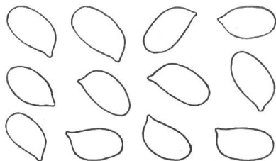
Spores grossies 1000 fois

Chair délicate, aqueuse, d'abord ocracé pâle à marbrures hyalines, puis presque blanche dans le chapeau et le centre du pied, mais restant ocracé pâle dans la partie corticale de ce dernier, à odeur et saveur faibles, mais agréables.