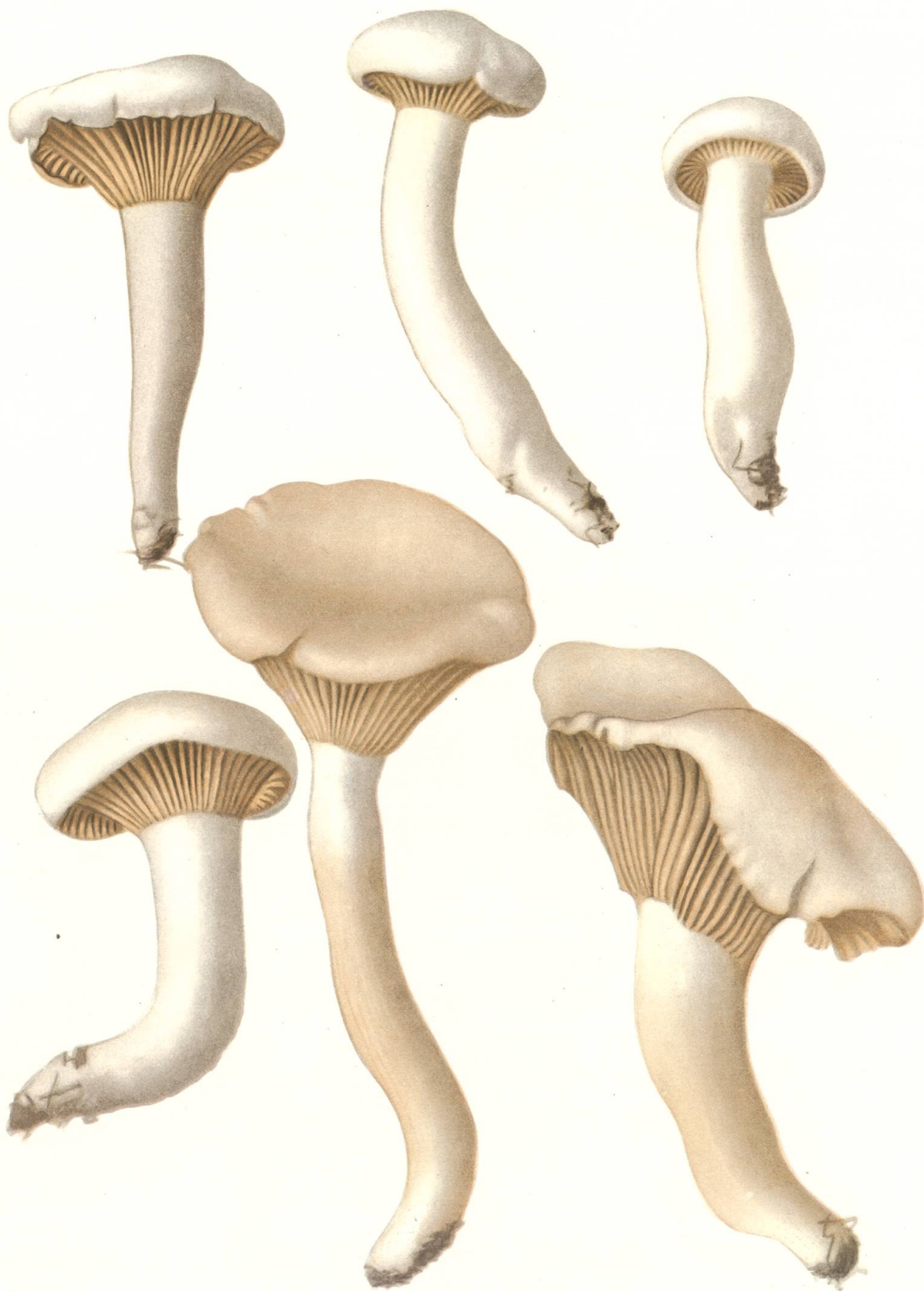
Hygrophorus Karsteni Sacc. et Cub.