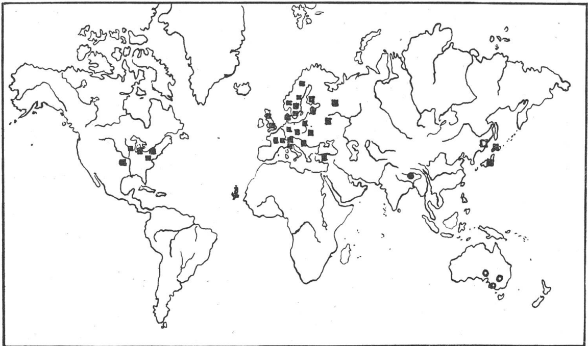
Fig. 1. Verbreitungskarte der vier Rozites-Arten.

Verbreitung: Gemäßigte Zone der nördlichen Hemisphäre (Sekt. Caperatae), bzw. in den Gebirgslagen des Himalaja und in der subtropischen Zone der südlichen Hemisphäre (Sekt. Australienses). (Vgl. Fig. 1.)