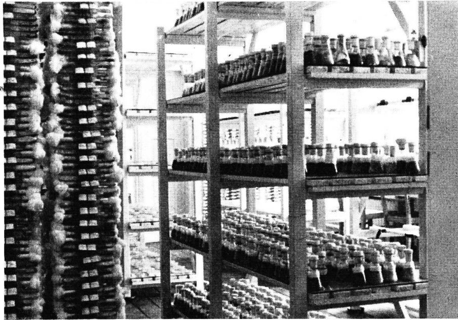
Blick in einen der Kulturräume

Benden Stopfen alle 3–4 Monate auf frische Nährböden überimpften und jeden Stamm stets 6fach halten, wobei für die Überimpfung jeweils die am besten gewachsene Kultur verwendet wird. Es findet so eine ständige Auslese statt. Aus diesen Stammkulturen impfen wir dann z. B. für Untersuchungen hinsichtlich antagonistischen Verhaltens der verschiedenen Pilzarten verpilzte Agarteile auf Nährböden in Petrischalen. Werden jeweils 2 verschiedene Pilzarten in eine Petrischale geimpft, läßt sich sehr gut beobachten, ob und wie stark eine Pilzpflanze die andere in ihrer Entwicklung hemmt. Aus diesem antagonistischen Verhalten lassen sich mancherlei Schlüsse hinsichtlich der Bildung von Wirkstoffen ziehen. Auch zur Vergesellschaftung verschiedener Pilzarten zeigen diese Arbeiten interessante Parallelen. Die biologische Wirksamkeit der ausgeschiedenen Wirkstoffe wird in Kulturversuchen mit höheren Pflanzen geprüft.