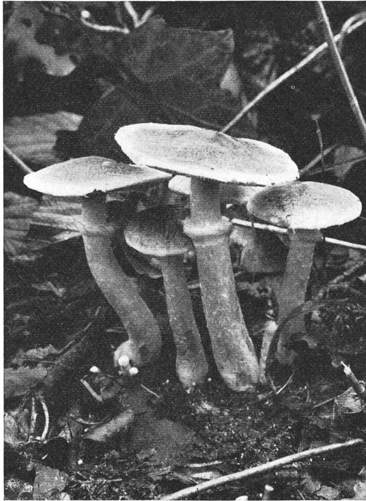
Photographische Aufnahme der Pilze durch St.Nikolaus von der Kiesgrube.