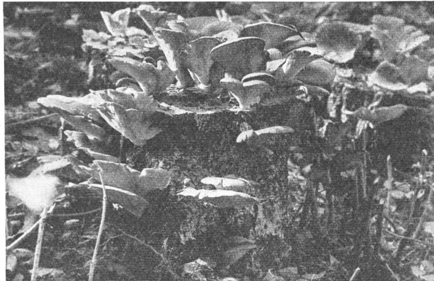
Abb. 7. Austern-Seitlinge, von unten gesehen

Die Produktion des Austernpilzes ist wirtschaftlich. In Ungarn bestehen etwa 84 % des Waldgebietes aus Laubwald, dessen Holzmaterial auch auf diese Weise verwertbar ware. Die Ansiedlung des Pappelbaumes fur Zellstoffherstellung zeigt einen besonderen Aufschwung. Einen Teil dieses Pappelertrags konnte man in die Pilzzucht einschalten. Mit dem beschriebenen Verfahren kann man auf einem Gebiet von einem Katastraljoch (5662 m 2 ) etwa 1700 q Holzmaterial zum Fruchtbringen ansiedeln. Das zur Pilzzucht geeignete schnittfeuchte Holz kostet bei Brennqualitat in Ungarn ca. 25 Ft./q. Rechnen wir die Impfkosten von ungefahr 90 Ft./q und noch ca. 25 Ft./q Arbeitslohn dazu, so betragen die Gesamtkosten im Durchschnitt 140 Ft./q Holz.