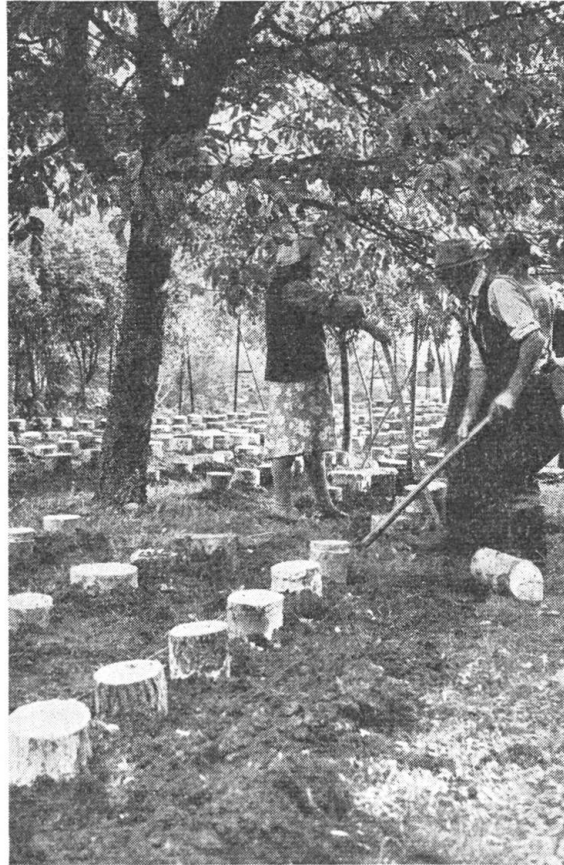
Abb. 3. Die eingepflanzten Klötze gelangen auf den Zuchtort

sitzenden Fruchtkörper hängt davon ab, an welchen Holzarten sie gezüchtet werden: auf Pappeln werden die Fruchtkörper rauchgrau oder blaßbraun, auf der Zerreiche stahlblau, und später fahlblau. Das Fleisch, die Lamellen und der Stiel sind schneeweiß. Nur das Ende des Stiels ist holzig-zäh, und wenn dieser Teil beim Pflücken entfernt wird, ist der Pilz saftig, fleischartig resch. Bezüglich des Geschmacks, des Aromas, der chemischen Zusammensetzung, des Vitamingehalts so-