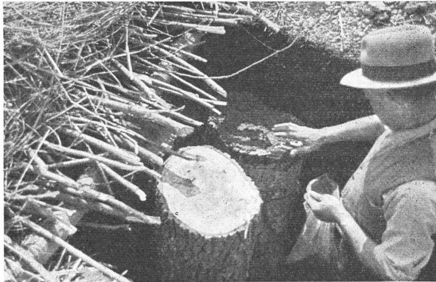
Abb. 1. Impfungsarbeit in der Erdmitte

Mit der betrieblichen Herstellung des zur Zucht notwendigen Impfstoffes, mit der Einimpfung der Holzsubstanz, mit der Durchflechtung desselben durch Myzelien und mit den Fragen der Auswahl des Zuchtortes haben wir uns fünf Jahre hin-