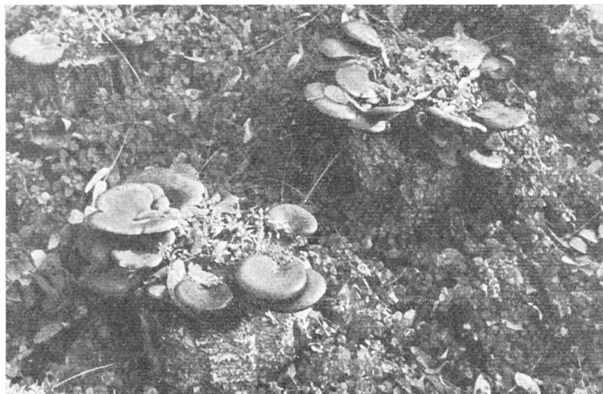
Abb. 4. Erstjährige Pappelklötze mit ihrem reichen Ertrag