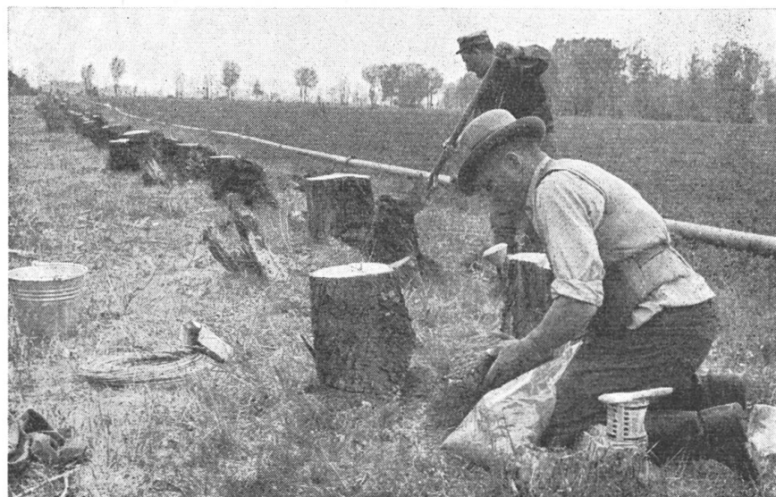
Abb. 2. Impfung von Pappelwurzelklötzen