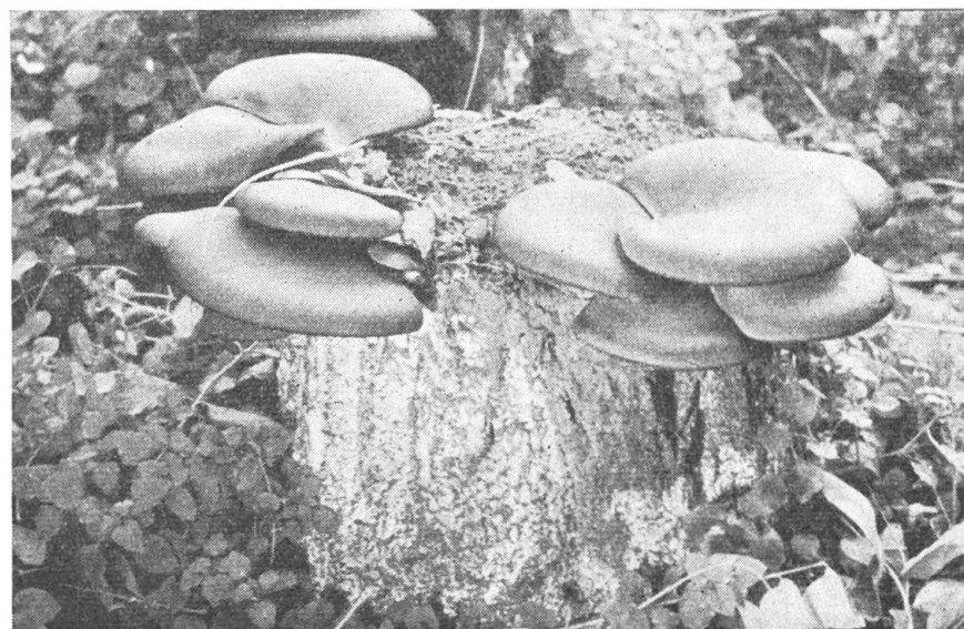
Abb. 8. Austern-Seitlinge, von oben gesehen