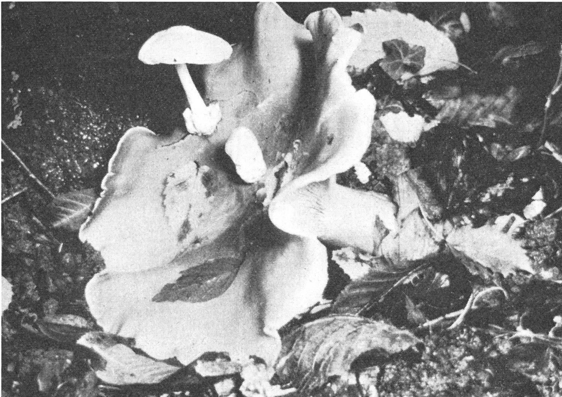
Im Hinblick auf ihre Funktion innerhalb des Naturganzen lassen sich die Pilze einteilen in Saprophyten, Parasiten und Symbionten. Unter den Parasiten gibt es – wie das Bild zeigt – gar solche, die bei ihren «Verwandten» schmarotzen (Parasitischer Scheidling auf Nebelgrauem Trichterling).

In was unterscheiden sich die beiden Pole? Im Bereich der Blüte stellen wir eine Tendenz zur Auflösung fest. In Blütenfarbe, Blütenduft und Pollen löst sich die Pflanze sozusagen in ihre Umwelt auf. Das Stoffwechselgeschehen dominiert am