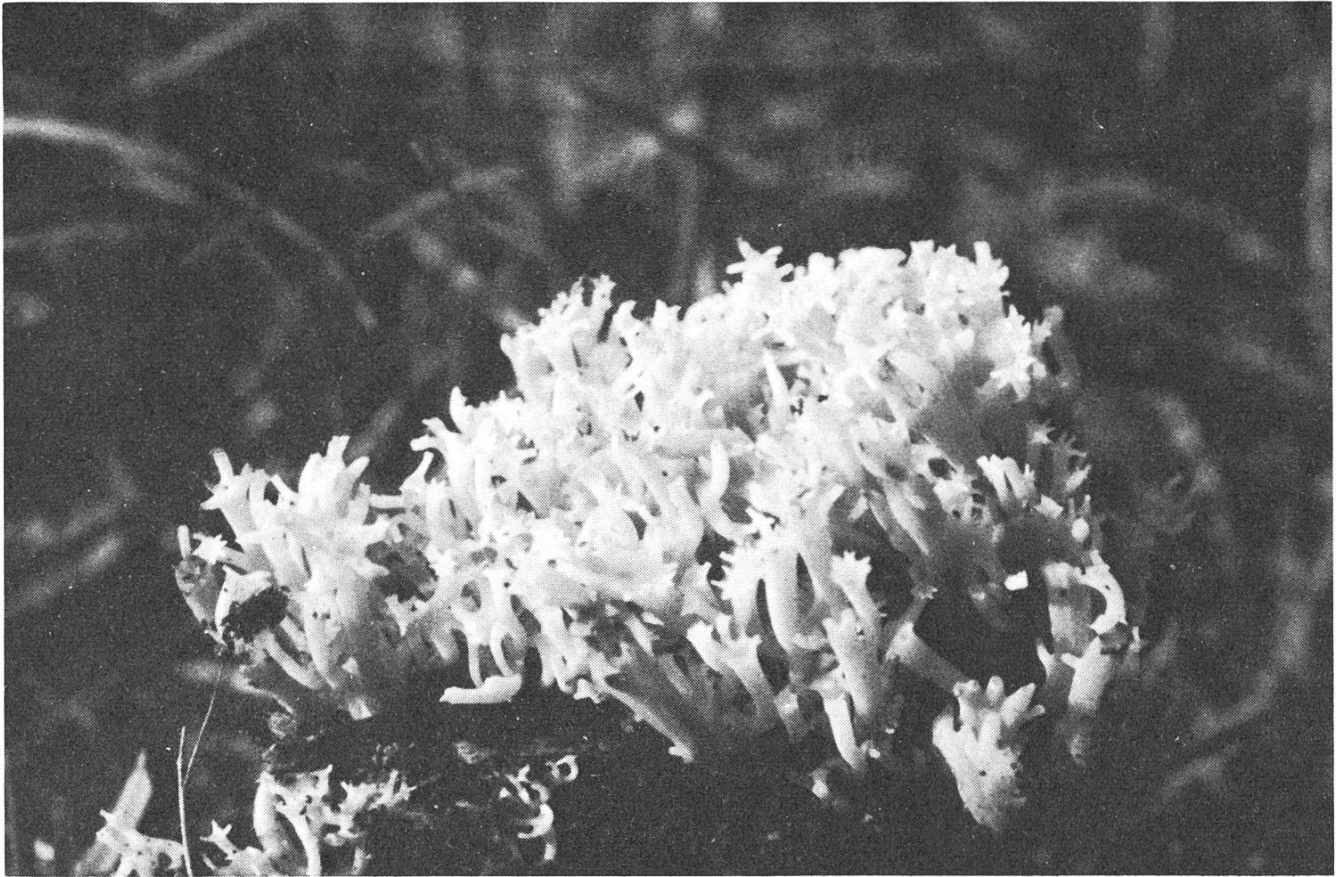
Clavicornia turgida (Lév.) Corner (Foto G. Lucchini).

La descrizione fatta da Corner a pag. 289 de «Clavaria and allied Genera» è corrispondente pure per le nostre raccolte, mentre la riproduzione fotografica in bianco e nero pubblicata nel «Supplement to «A monograph of clavaria ...», plate 1. – è quasi identica alla nostra raccolta del 5. 7. 1972.