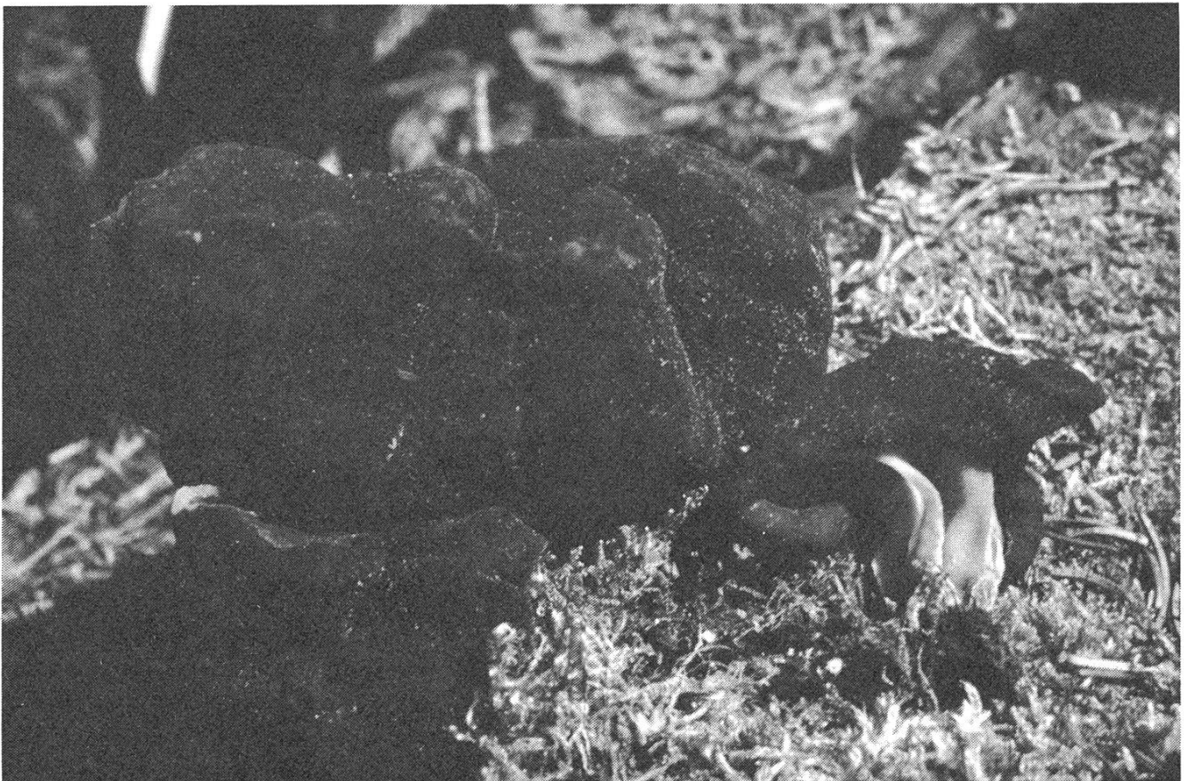
Pseudorhizina sphaerospora . Unten: Habitus. Oben: Asci, Paraphysen und Sporen.