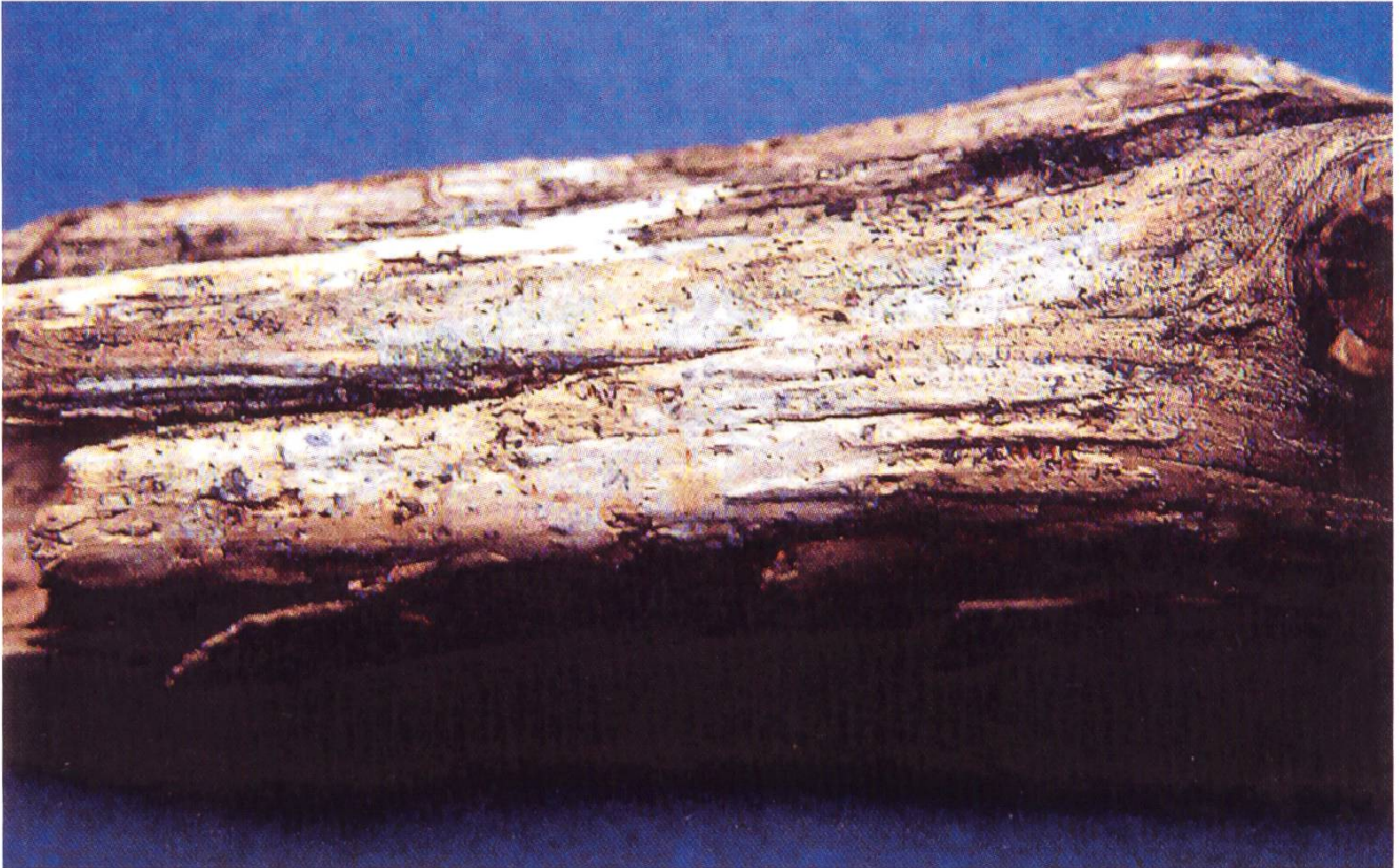
Studioaufnahme mit dem unscheinbaren Fruchtkörper von Tubulicrinis sororius . Une photo en laboratoire d'une fructification presque invisible de Tubulicrinis sororius .