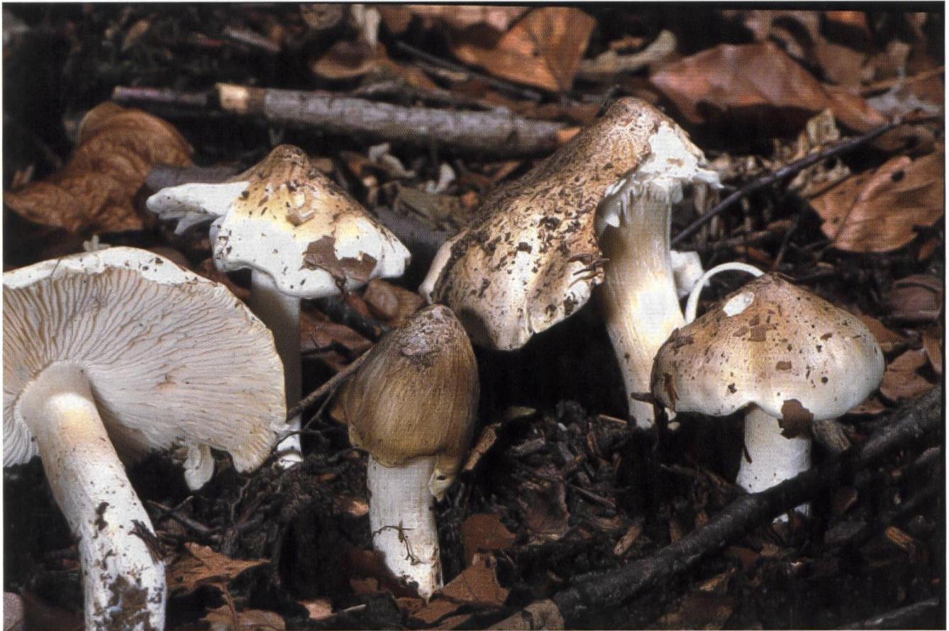
Tricholoma umbanotum , Seidiggrauer Buckel-Ritterling