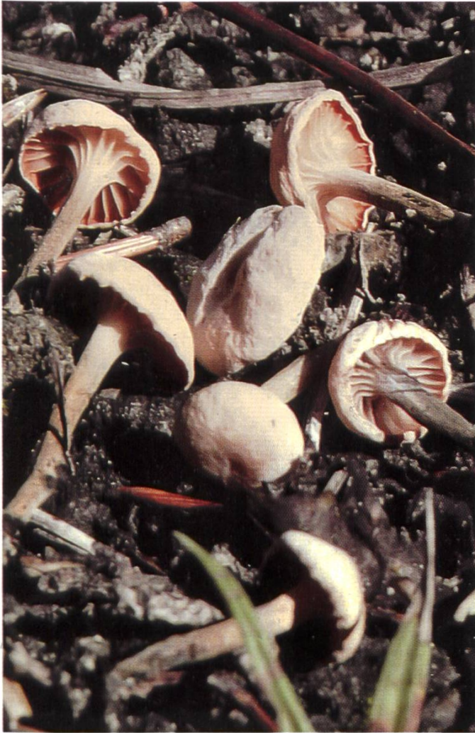
M. tricolor am Standort | dans son environnement var. graminis

förmigen, dickwandigen, im untern Teil braunen Hyphenenden und mehr oder weniger deutlich differenzierten Kaulozystiden. Diese ziemlich vielgestaltig von zylindrisch bis schwach keulenförmig mit Einschnürungen und kurzen fingerförmigen Auswüchsen (Ramealis-Struktur) im unteren Teil, dickwandig und teilweise olivschwärzlich.