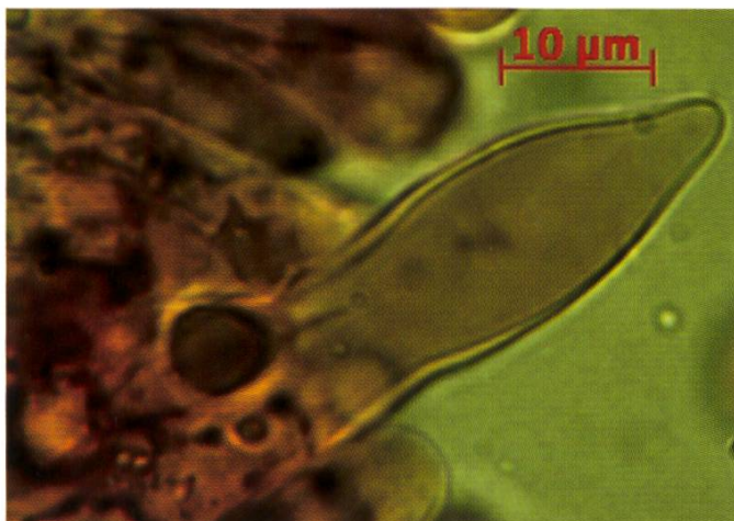
R. amoenicolor Pleurocystides | Pleurocystiden

Hyménium > Basides tétrasporiques, environ 50 × 10 μm. Cheilocystides en masse, pointues, souvent sinueuses, plutôt épaisses de paroi. Pleu-