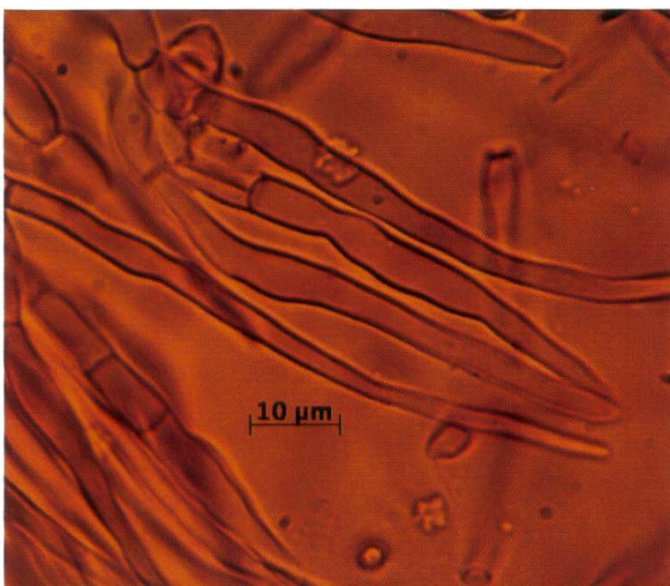
R. amoenicolor Haare der HDS | Poils piléiques

R. amoenicolor wird sehr oft mit R. amoena verwechselt. Diese ist aber deutlich kleiner und schwächer, nie so massiv, der Hutrand ist meistens auch alt etwas eingerollt. Violette Formen von R. violeipes sind ebenfalls nicht auszuschließen, weichen aber durch ihren mehr kugeligen Habitus und die auffällig tönchenförmig unterteilten Huthaare ab. Oberflächlich kann R. amoenicolor natürlich auch mit Arten der Sektion Sardoninae Singer um R. queletii (Stachelbeertäubling) oder R. torulosa Bresadola (Gedrungener Täubling) verwechselt werden, diese sind jedoch ausnahmslos scharf.