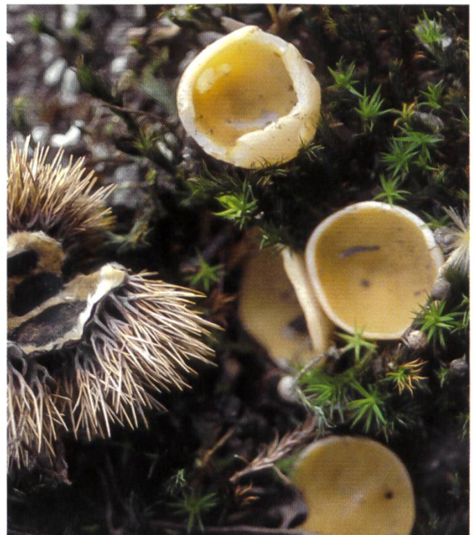
Discina leucoxantha nel habitat