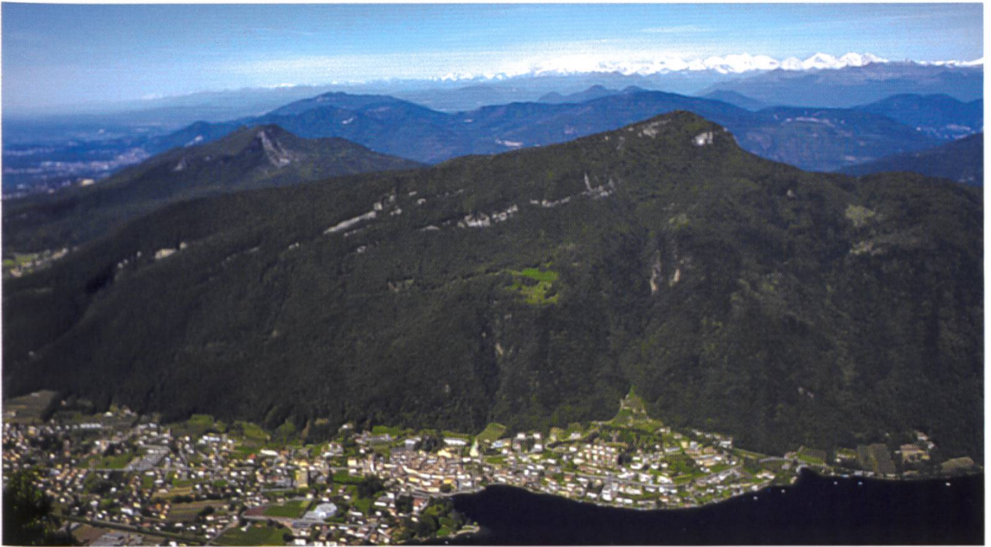
Monte San Giorgio (1096 mslm) e Poncione di Arzo (1015 mslm)