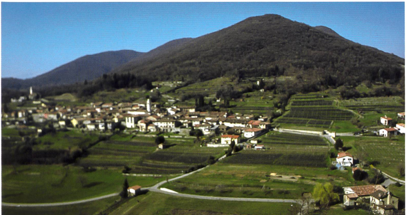
Meride sede Museo e visitor center

1994, qui ont trouvé des espèces particulièrement intéressantes (documentés et déposés dans des herbiers), sont cordialement invités à nous envoyer leurs données jusqu'au 31 décembre 2007. Ces informations seront ajoutées aux 1200 espèces déjà recensées dans cette région intéressante de seulement 25 km 2 et déposées dans les herbiers de LUG et INO.