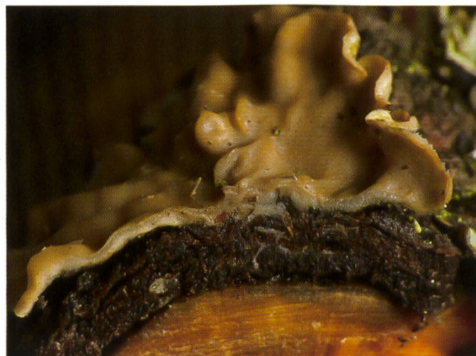
Cytdiella melzeri Schnitt durch Fruchtkörper