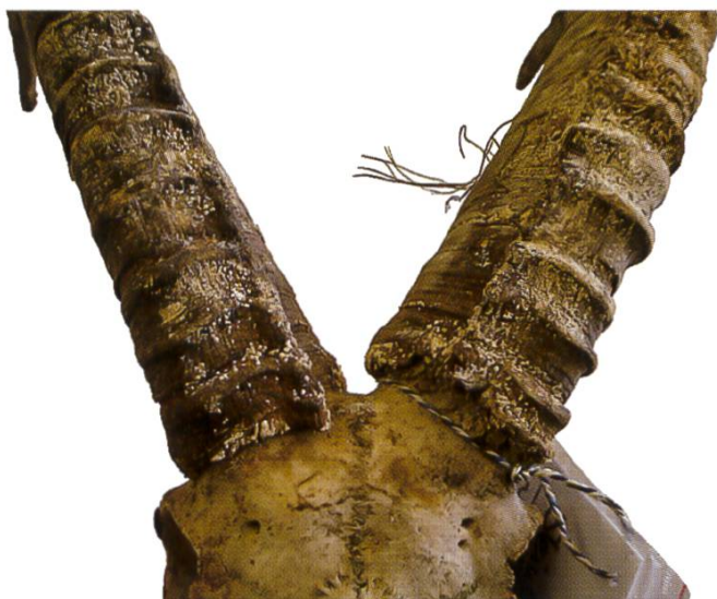
Fig. 1 Steinbockgehörn mit Pilzbewuchs

Allerdings zeigt ein Blick in die Nomenklaturdatenbank Index fungorum ( http://www.indexfungorum.org/Names/Names.asp ), dass noch zwei weitere Onygena -Arten beschrieben worden sind, die in Frage kommen könnten: Onygena arietina , beschrieben von einem Widdergehörn in Davos mit sehr dunklen Farben, und Onygena caprina mit zitronenförmigen Sporen (vgl. Tabelle 1).