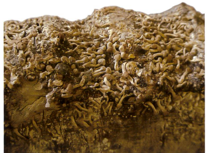
Fig. 2 Fruchtkörper von Onygena equina

Dieser Schlauchpilz gehört zu einer Gattung, die weltweit nur ganz wenige Arten aufweist und mit ihrer speziellen keratinophilen Lebensweise charakterisiert ist. Die kugeligen Köpfchen können als Kleistothecium oder Peridien bezeichnet werden. Die Sporenoberfläche ist sehr fein netzartig ornamentiert, wie rasterelektronenoptische Bilder zei-