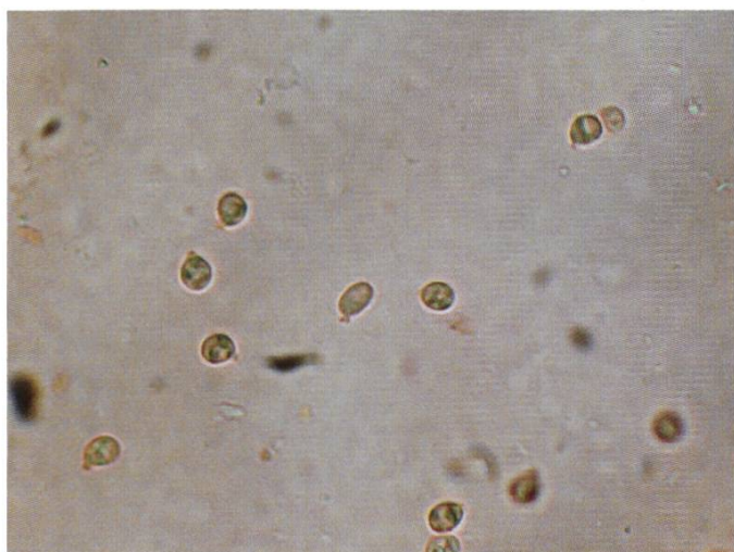
Spore | Sporen | Spores

Epicute > Rivestimento pileico subtrichodermico a palizzata o physalo-palissadoderma, secondo la classificazione proposta da Cléménçon (1996), evocanti a tratti una tipica struttura xerocomoide. Composto da ife erette con cellule a parete spessa frequentemente settate-catenulate e caratterizzate da un pigmento brunastro intracellulare. La morfologia risulta assai variabile con elementi cilindrici-ovaliformi, suballantoidi. Le ife terminali sovente a forma di capsula o proiettiliforme e il rivestimento epiparietale risulta privo di incros-