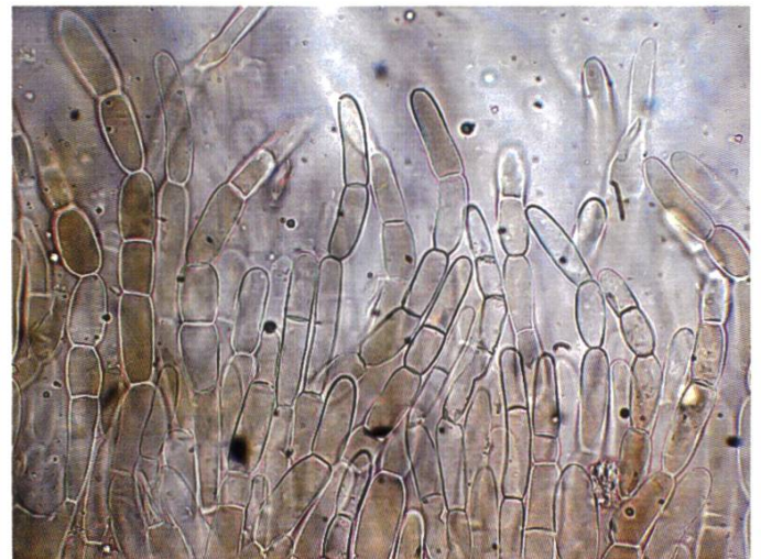
Rivestimento pileico | Hutdeckschicht | rev. piléique

Habitat: Zona collinare pianeggiante 480 m s.l.m. Bosco interno, in tratto molto umido-ombroso con ( Fraxinus-Pseudotsuga menziesii-Fagus-Quercus-Pinus ), su terreno calcareo, substrato misto argilloso-sassoso ricco di carbonati, superficie colonizzata completamente da formazioni muscose, ricoperta per larghi tratti di detriti legnosi molto degradati. Rinvenuti circa 30 esemplari sparsi a