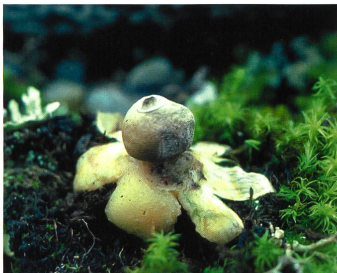
Geastrum minimum une espèce typique des terrains xériques genevois

L'exceptionnelle diversité des milieux permet le développement optimal d'une flore fongique très variée et souvent inattendue. Les prospections se poursuivront ces prochaines années afin de révéler la fonge de cette réserve si importante pour la biodiversité.