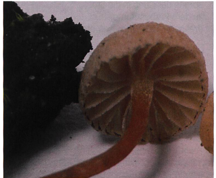
Abb. 1 Feinste Velumfasern am Hutrand

In der letzten Nummer der SZP (6/2010) haben wir eine seltene helmlingsartige Pilzart mit braunem Sporenpulver porträtiert und deren umstrittene Gattungszugehörigkeit diskutiert. Die Abbildung auf Seite 225 zeigt die frischen Fruchtkörper dieser Art von Torfboden. Zum besseren Verständnis unserer anfänglichen Bestimmungsschwierigkeiten sollen im Folgenden weitere Fotos gezeigt werden. Die Nahaufnahme eines Hutes von unten (Abb. 1) zeigt den von feinsten Velumfasern bekränzten Hutrand, dunkelbraun gefärbt vom Sporenpulver, die flockig bereifte Stielspitze und die bewimperten Schneiden. Die glatten Sporen mit kleinem zentralem Keimporus sind in Abbildung 2 zu sehen, die dünnwandigen, dicht stehenden Cheilozystiden in Abbildung 3. Die Strichzeichnung fasst die wichtigsten mikroskopischen Merkmale zusammen (Hutdeckschicht HDS, Basidien, Sporen, Cheilozystiden CH, Caulozystiden CA der Stielspitze).