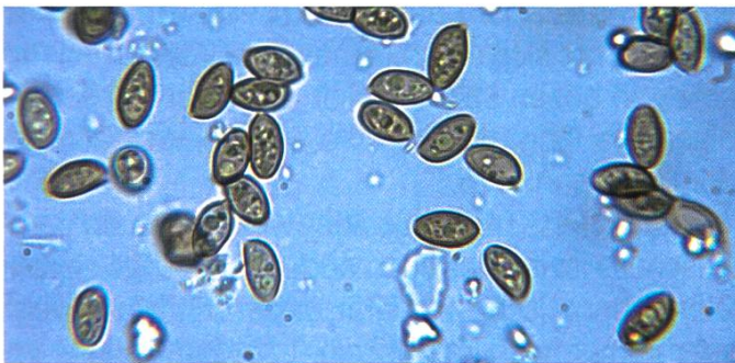
Abb. 2 Sporen von Psilocybe subfufispora