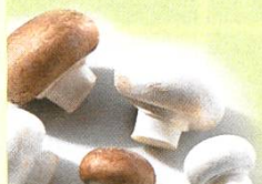
Champignon de Paris