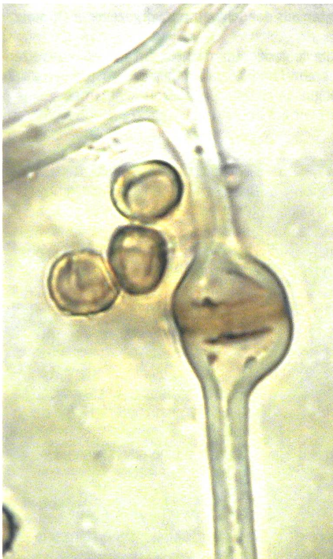
Capillitium von Tulostoma brumale