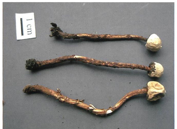
Fruchtkörper von T. squamosum (coll. Pardièni GR)