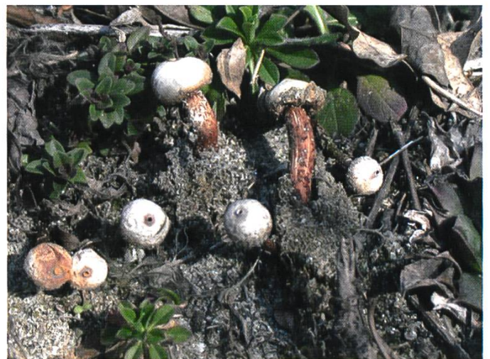
Fruchtkörper von T. melanocyclus (coll. 02/19, Dorénaz VS)