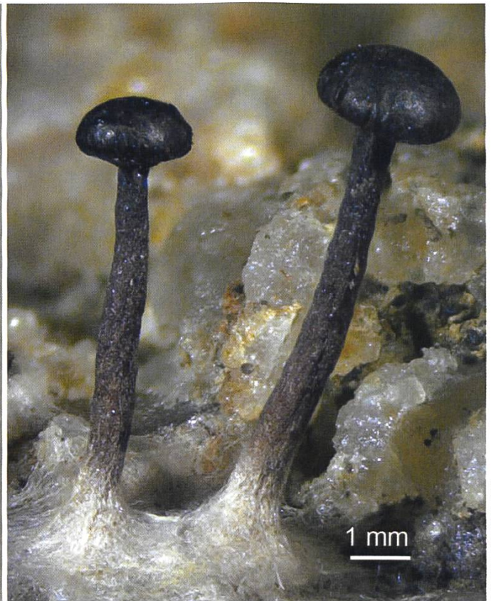
Heydenia alpina Die Peridien sind abgesplittert und die blasse Sporenmasse ist sichtbar.