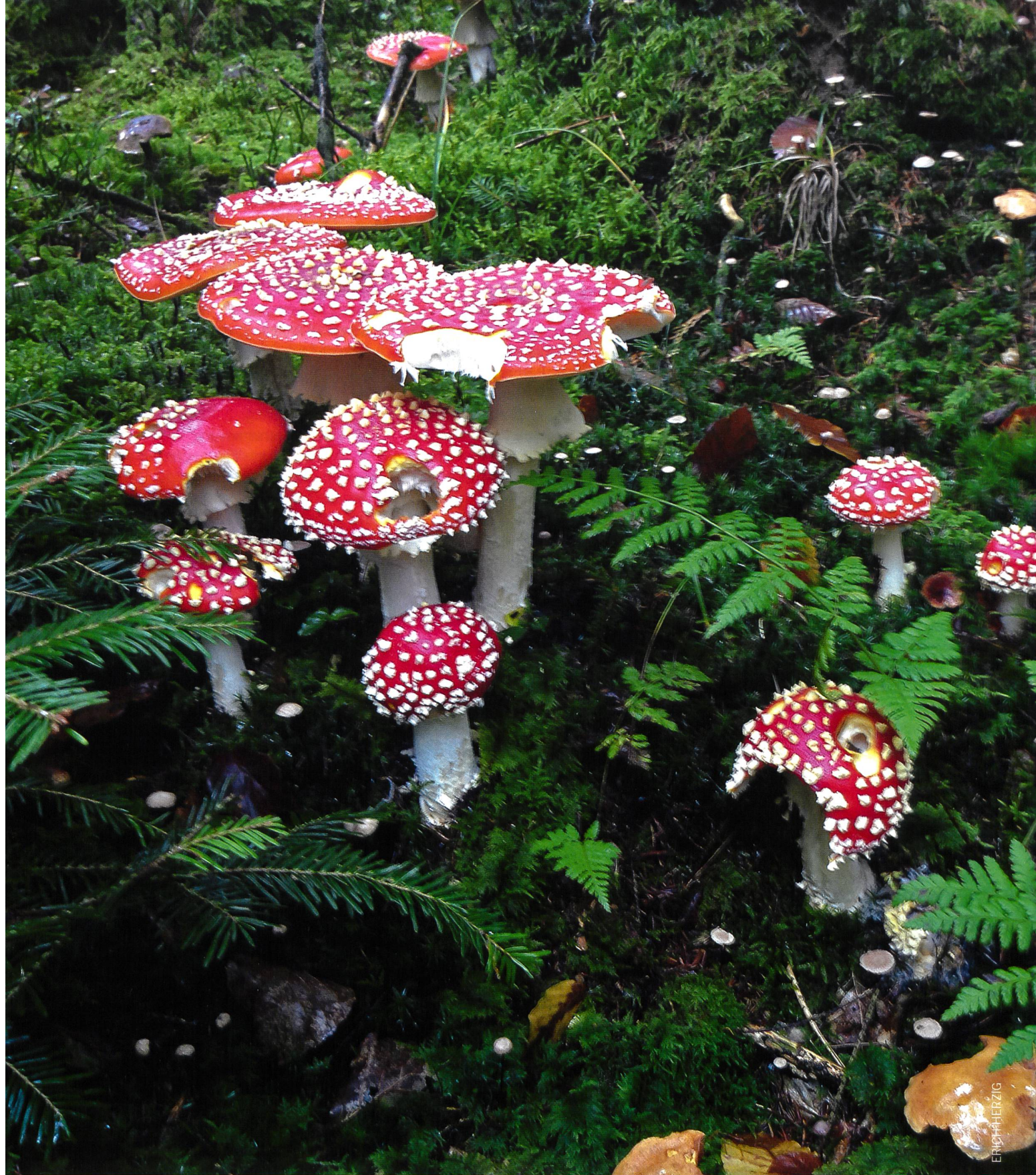
Eine Gruppe Fliegenpilze ( Amanita muscaria ). Un groupe d'Amanite tue-mouches ( Amanita muscaria ).