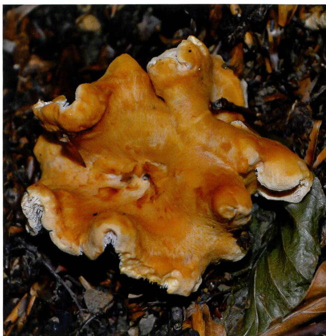
HYDNUM ELLIPSPORUM Fruchtkörper am Standort im Val Muggio | Fructification sur sa station de la vallée de Muggio

FRIEBES G. 2013. Zum derzeitigen Kenntnisstand der Stoppelpilze ( Hydnum ) in Europa. Tintling 2013 (5): 53–57.