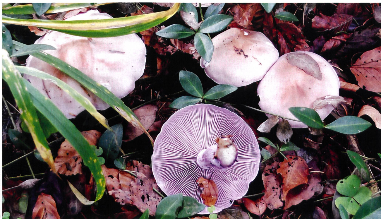
Fig. 14 Pied bleu ( Lepista nuda ) | Abb. 14 Violetter Rötleritterling ( Lepista nuda )