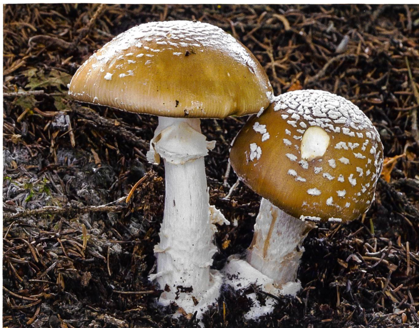
AMANITA PHALLOIDES Grüner Knollenblätterpilz | Amanite phalloïde