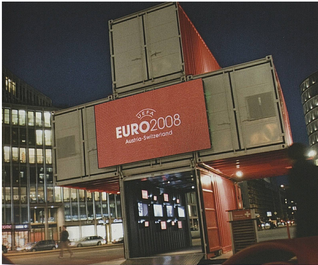
Il «più» svizzero pronto a rivelarsi a Berlino: l'«ICON» ha destato sensazione in tutta Europa. The Swiss "plus" stands in Berlin ready to be discovered: the "ICON" caused a stir throughout Europe.