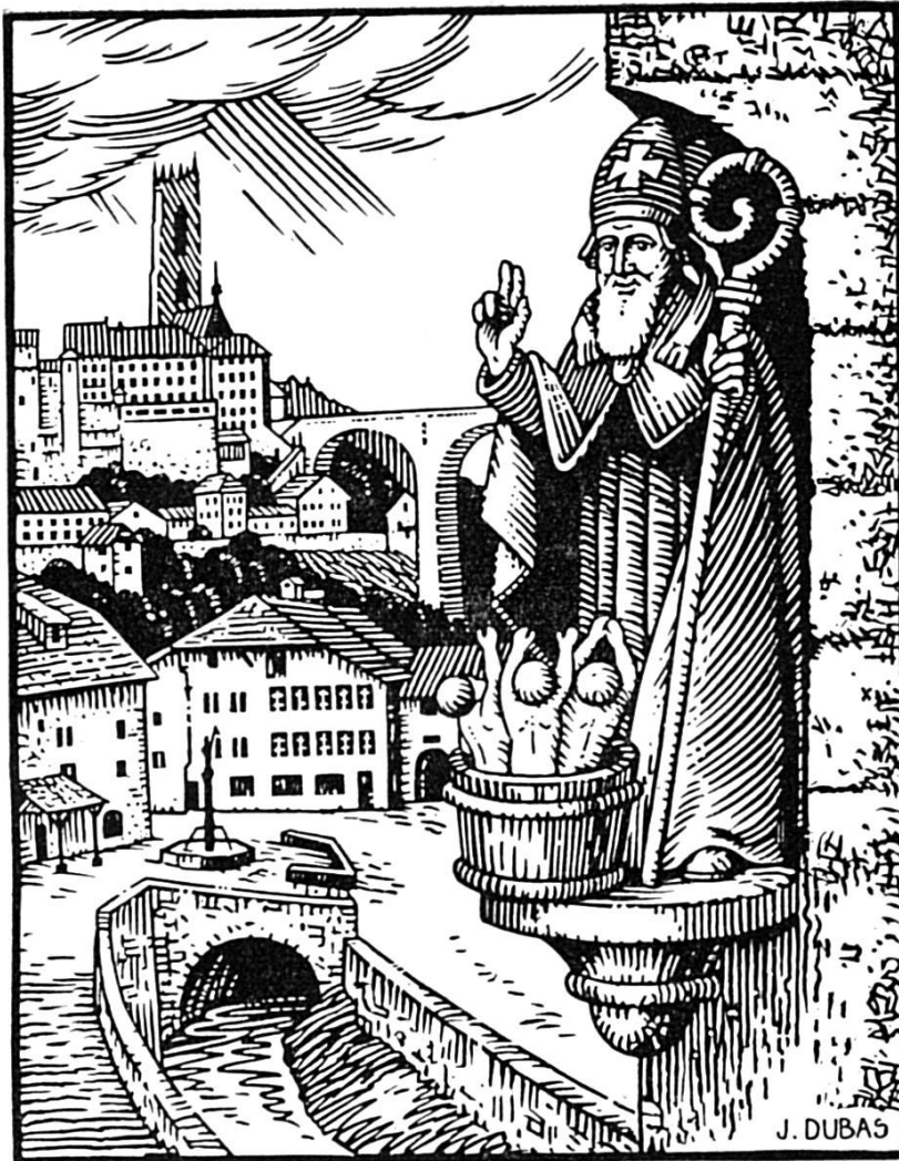
Reichlen Eugen: Der Samichlaus als Schutzpatron vo Fryburg mit de 3 arme Schüeler, won er wider uferweckt het.

verhulfe, wo Hunger und Not scho ibroche gsi si. Drum het er d'Matrosen usem Sturm grettet, wo si ihn um Hilf agrüeft hei. — Aber won er zu däm alte Metzger, zum Mönscheschlächter und syr Frau cho isch, wo het drü armi Chind gmetzget und igsalze gha, het der Samichlaus fasch nümme Geduld chönne ha. Er, wo in allne Christeverfolgunge standhaft und rüejig bliben isch, hätti dä alt Mönschefrässer am liebschte verfluecht und i di ewigi Marter gschickt. Aber au denn het er no d'Stim vom liebe Gott und vom Heiland ghört. Er het die drü arme Schüeler wider zum Läben uferweckt und em grusige, alte Mönschefrässer und Sünder der Wäg zeigt zur Reui, zur Bueß und zum neue Läbe.