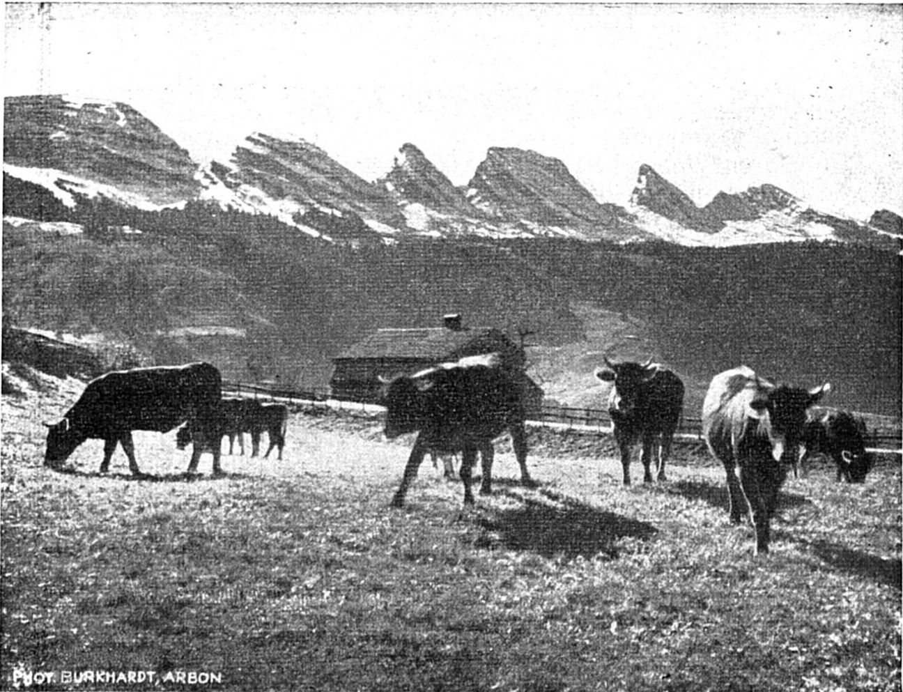
Obertoggenburg mit Churfirnen