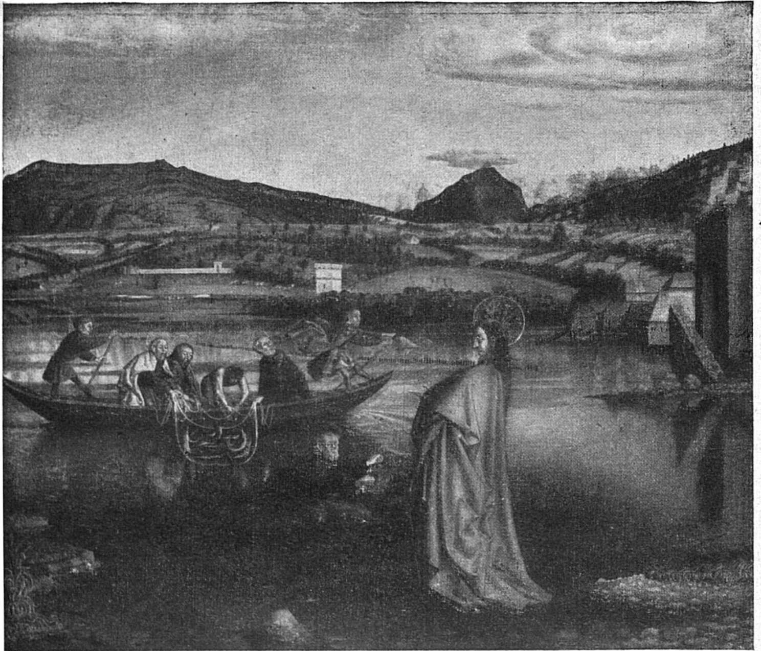
Conrad Witz: Der wunderbar Fischfang

NB. Das Bild vo der Gänfer Seebucht isch eis vo den erste Landschaftsbilder i der Schwyz.