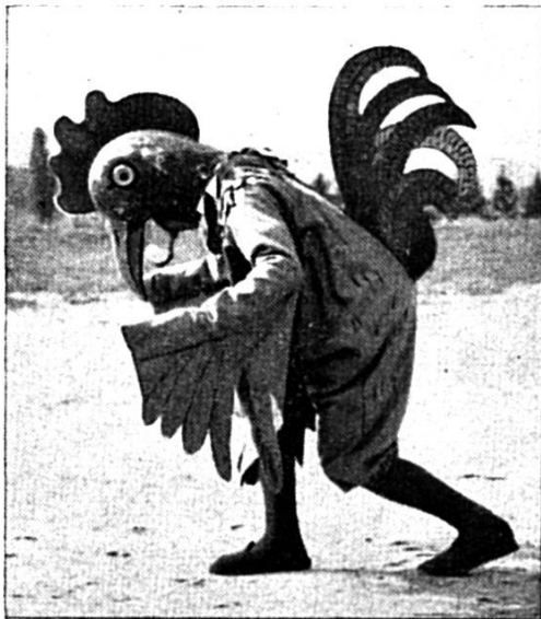
Das isch der Güggel us dr „FRAU HOLLE.“

Völlig ungewohnt wirkte das anheimelnde Mundartsprechen im klassischen Märchenland, und gerade in dieser Lebensnähe, die der Dialekt den bekannten Märchenfiguren gab, lag ein Hauptmoment der starken, unmittelbaren Wirkung.