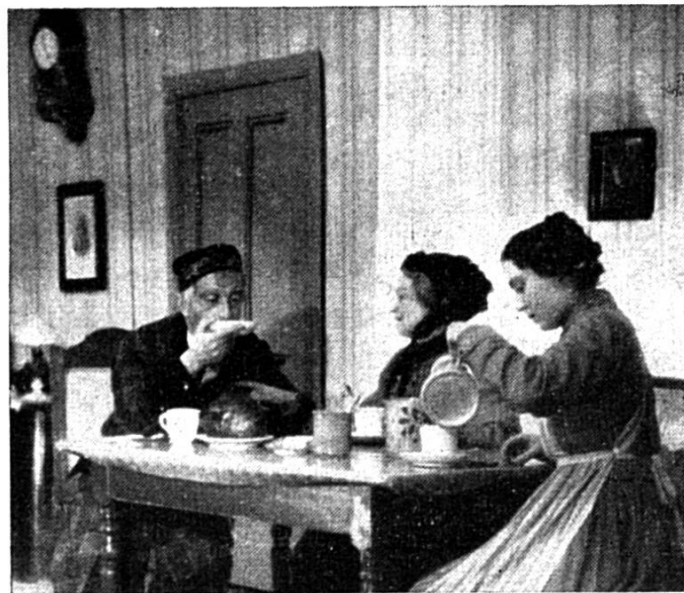
D'Familie Knörri bim Morgenässe

Die Spieltruppe der Heidi-Bühne interpretiert dieses heimelige Lustspiel mit viel Verständnis. Sie stellt das Berner Kleinbürgertum um 1905 mit einer behaglichen Freude dar, die sich rasch auch auf das Publikum überträgt.