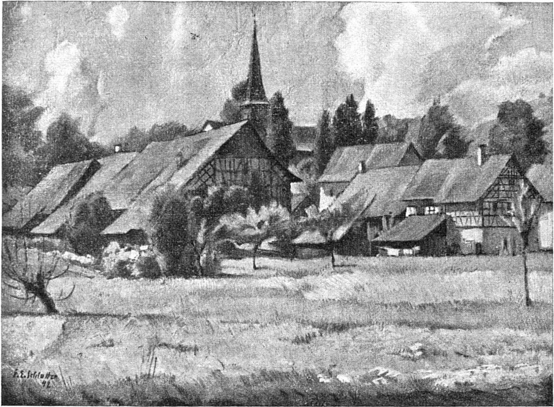
SCHLATTINGE, Gemälde vom Ernst F. Schlatter.