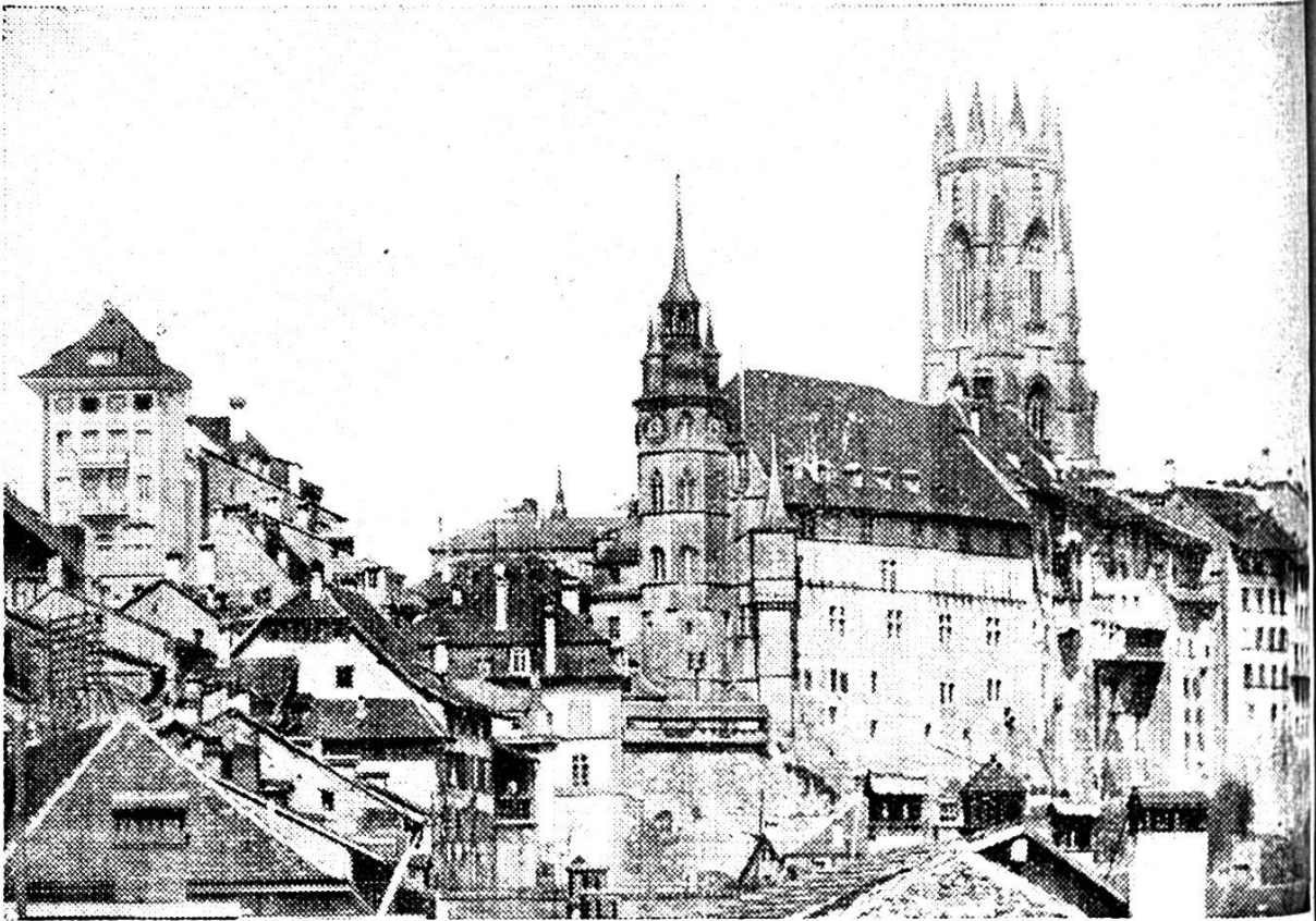
Alt-Fryburg mit Rathaus und Santi Chlous Chirche