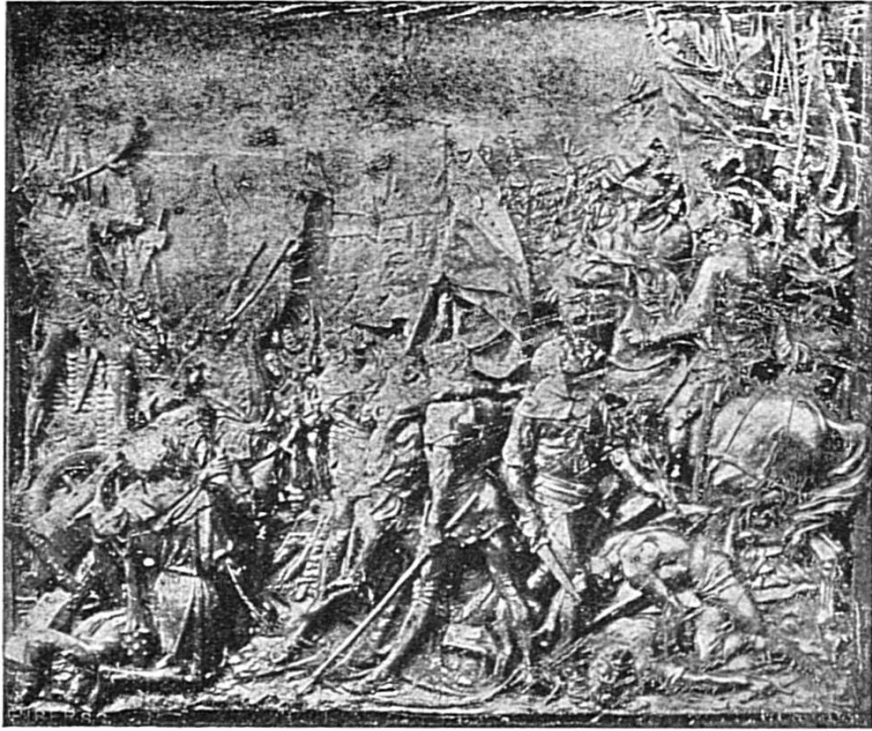
Schlacht bi Murte