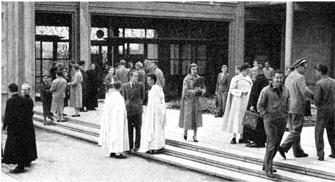
Studänte us vilne Länder brichte zäme