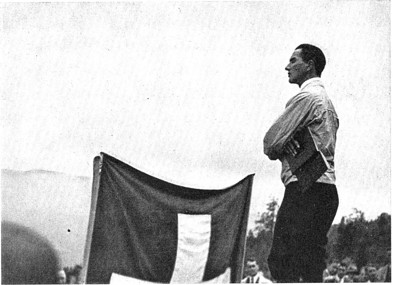
Der Dichter as Feschtedner i jüngere Johre