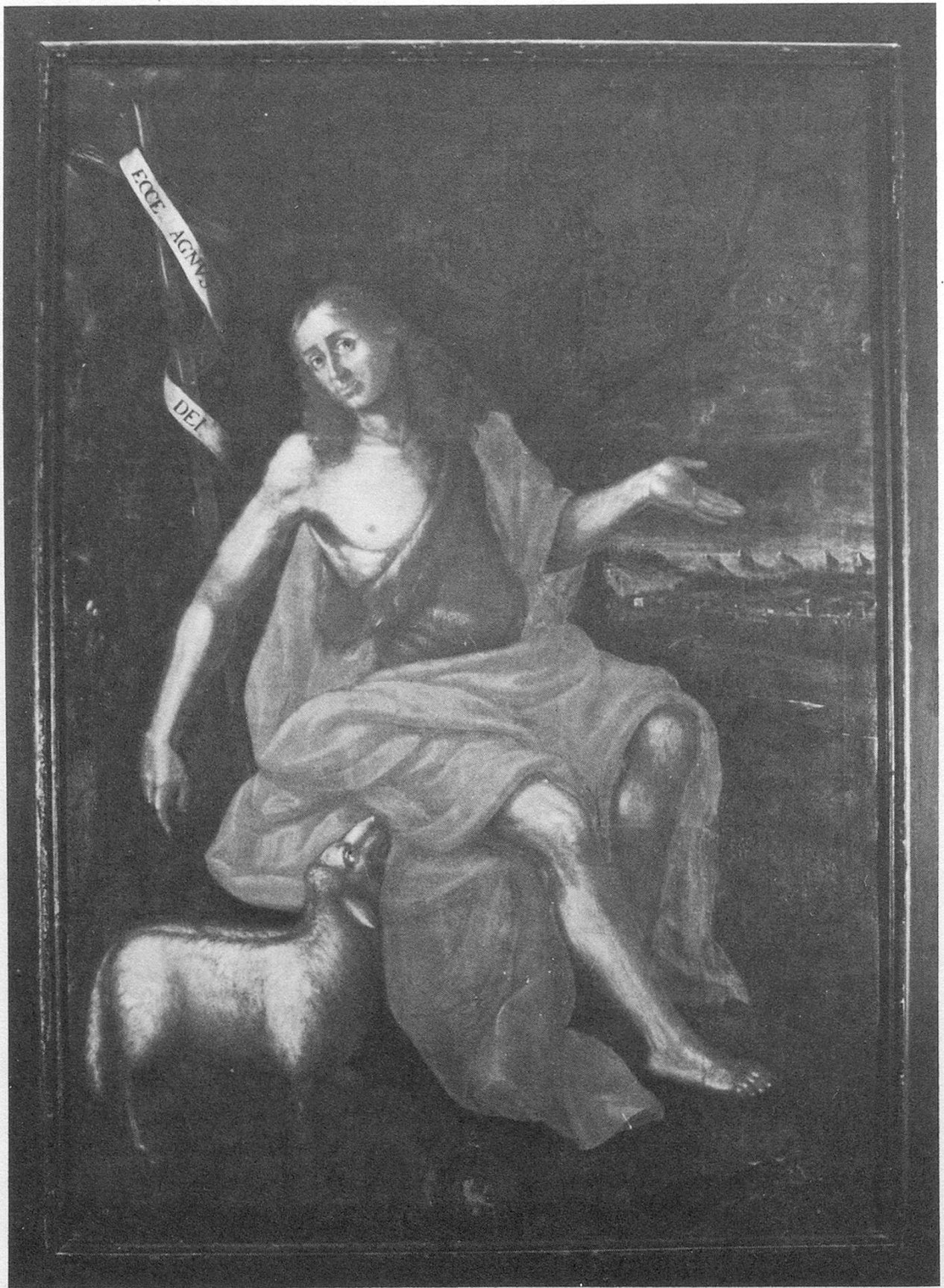
Abb. 5 Johannes der Täufer. Ölbild von Lucas Wiestner, 1691.