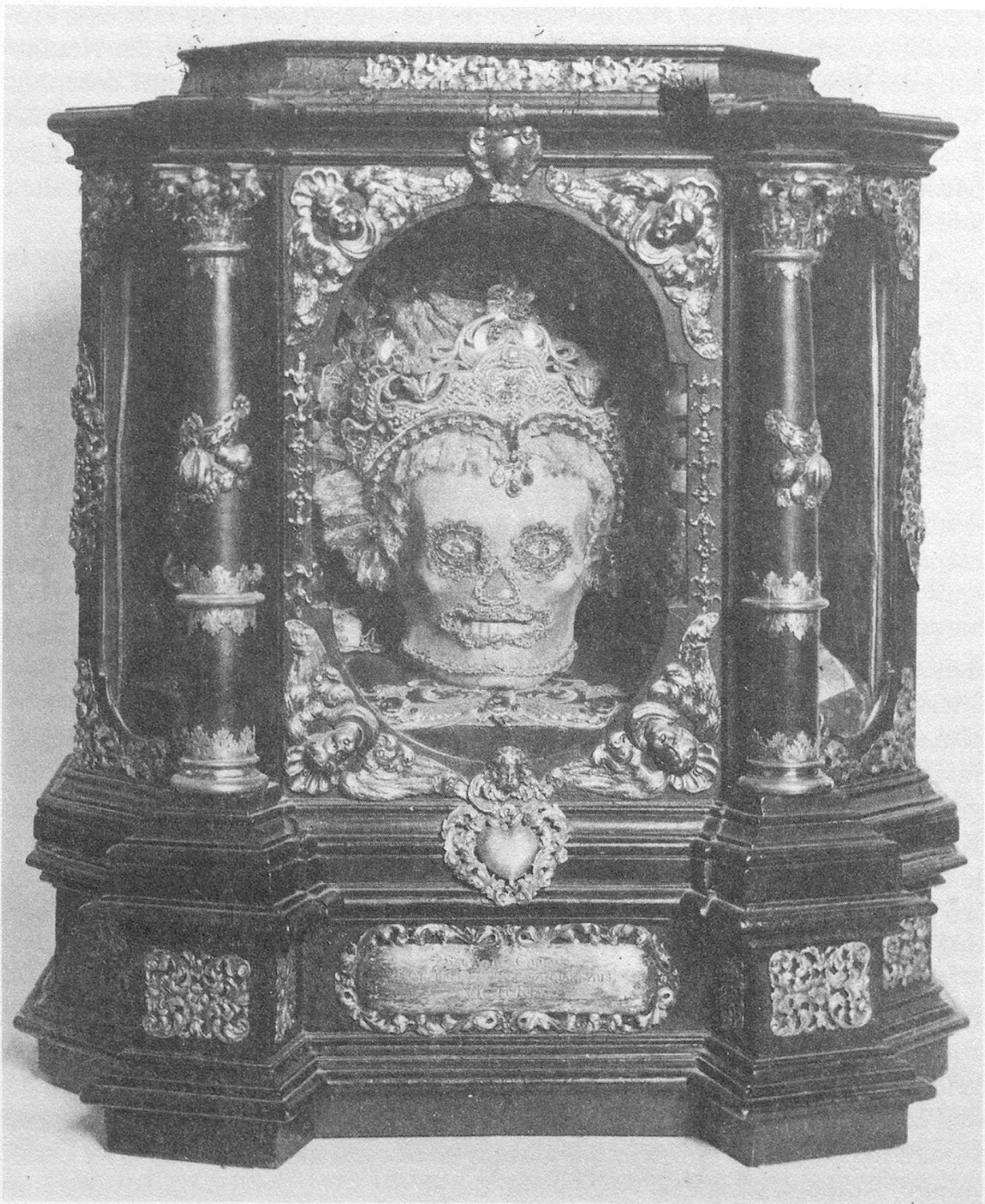
Abb. 1 Reliquiar der heiligen Victoria. 1692; 1769 neu gefasst.