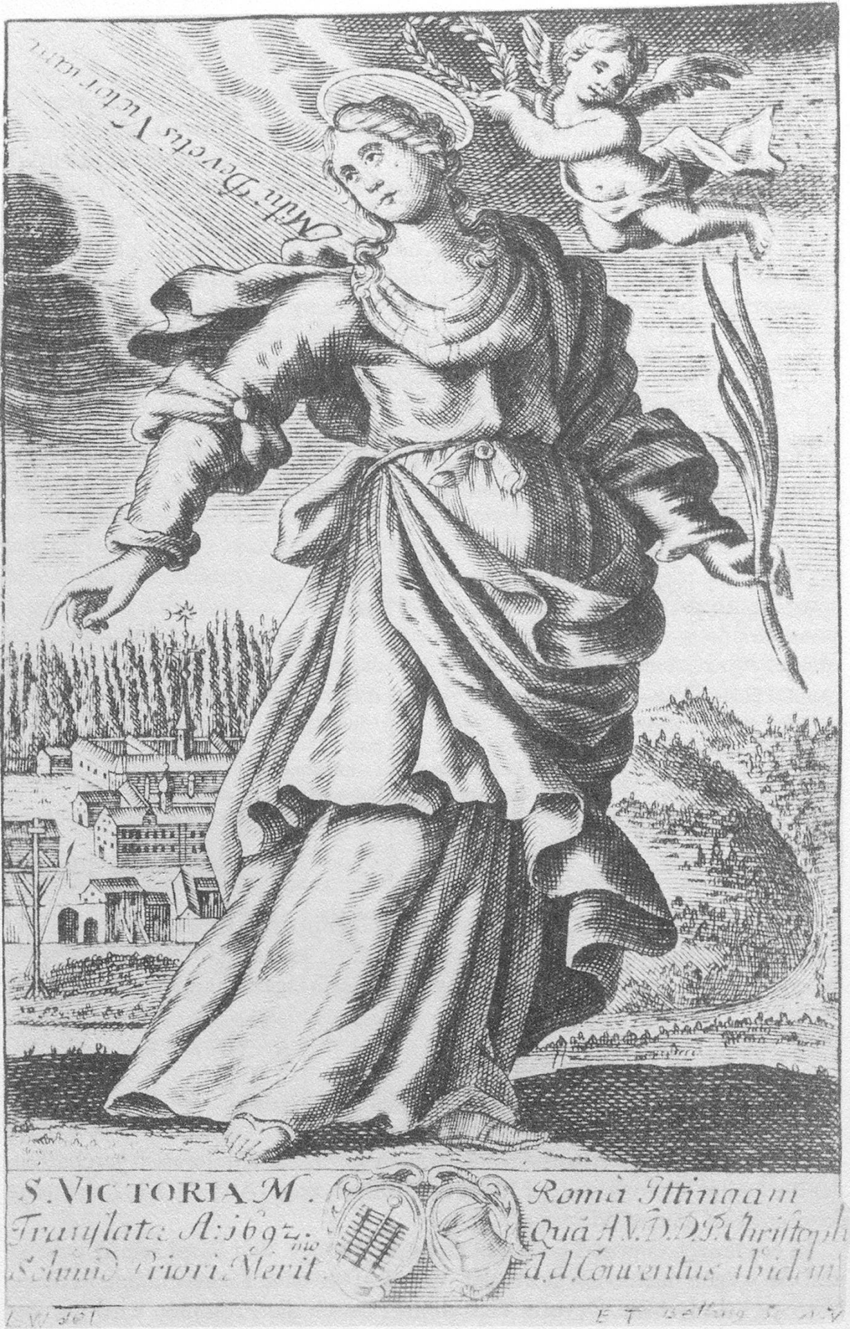
Abb. 4 Heilige Victoria. Kupferstich von Lucas Wiestner, um 1692.