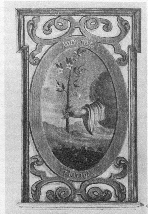
Abb. 3 Victoriakapelle. Wandfelder, gemalt von Lucas Wiestner 1697.