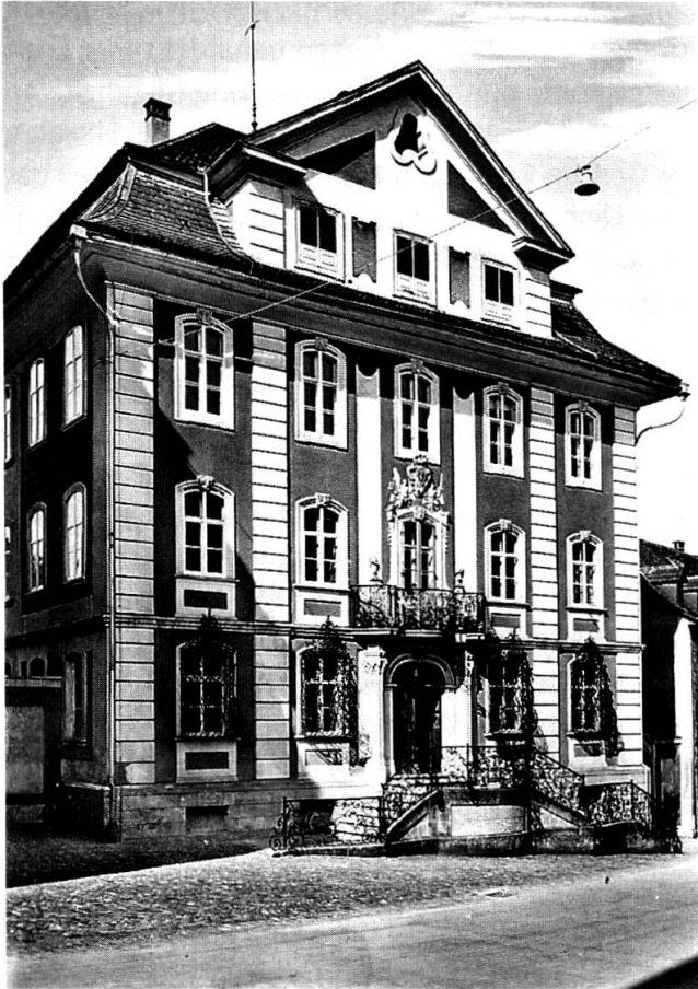
Abb. 2: Das Rathaus von Bischofszell, erbaut 1747–1750, unter anderem Sitz des helvetischen Distriktsgerichts.